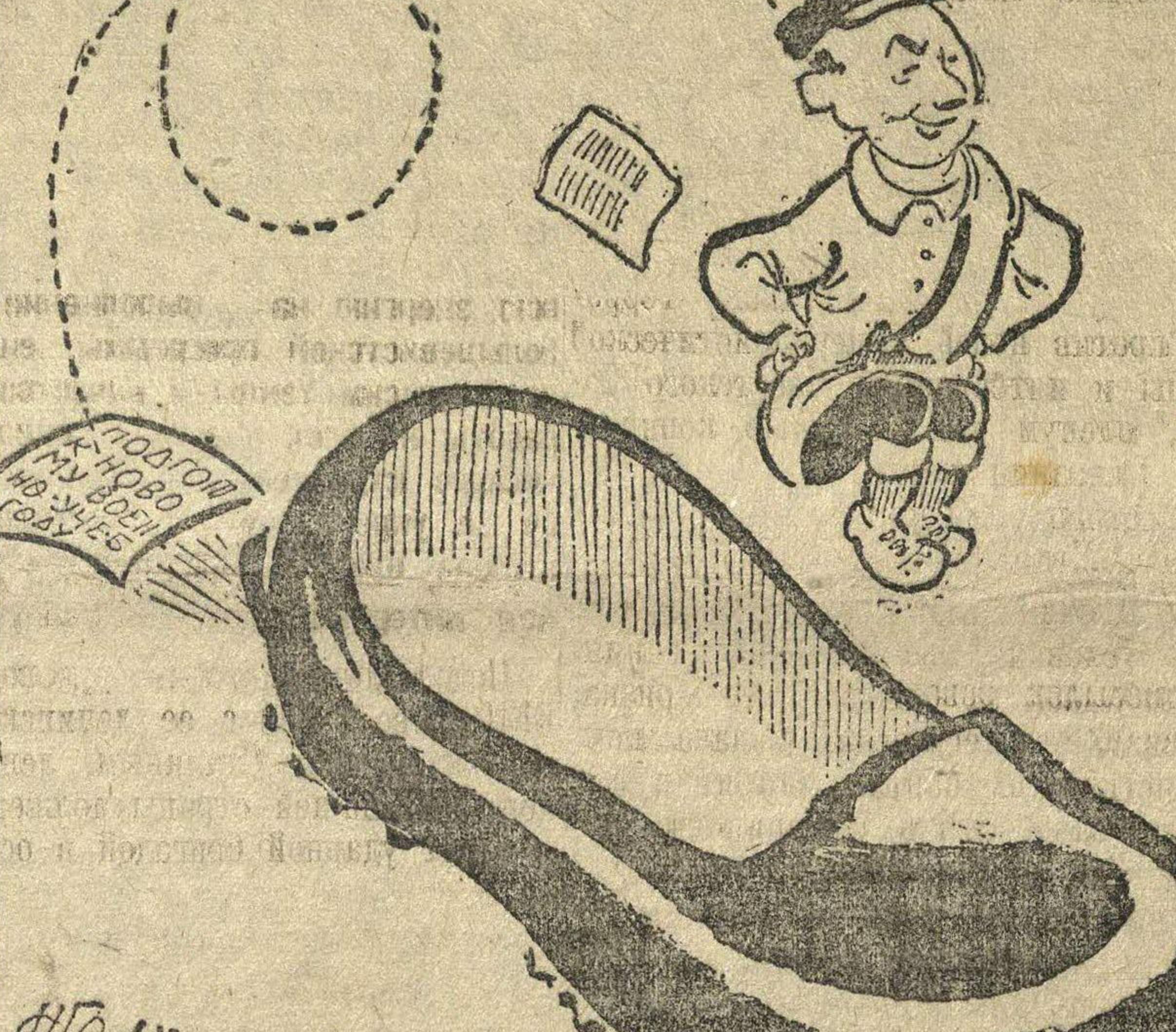
Готовы сесть... за военную учебу