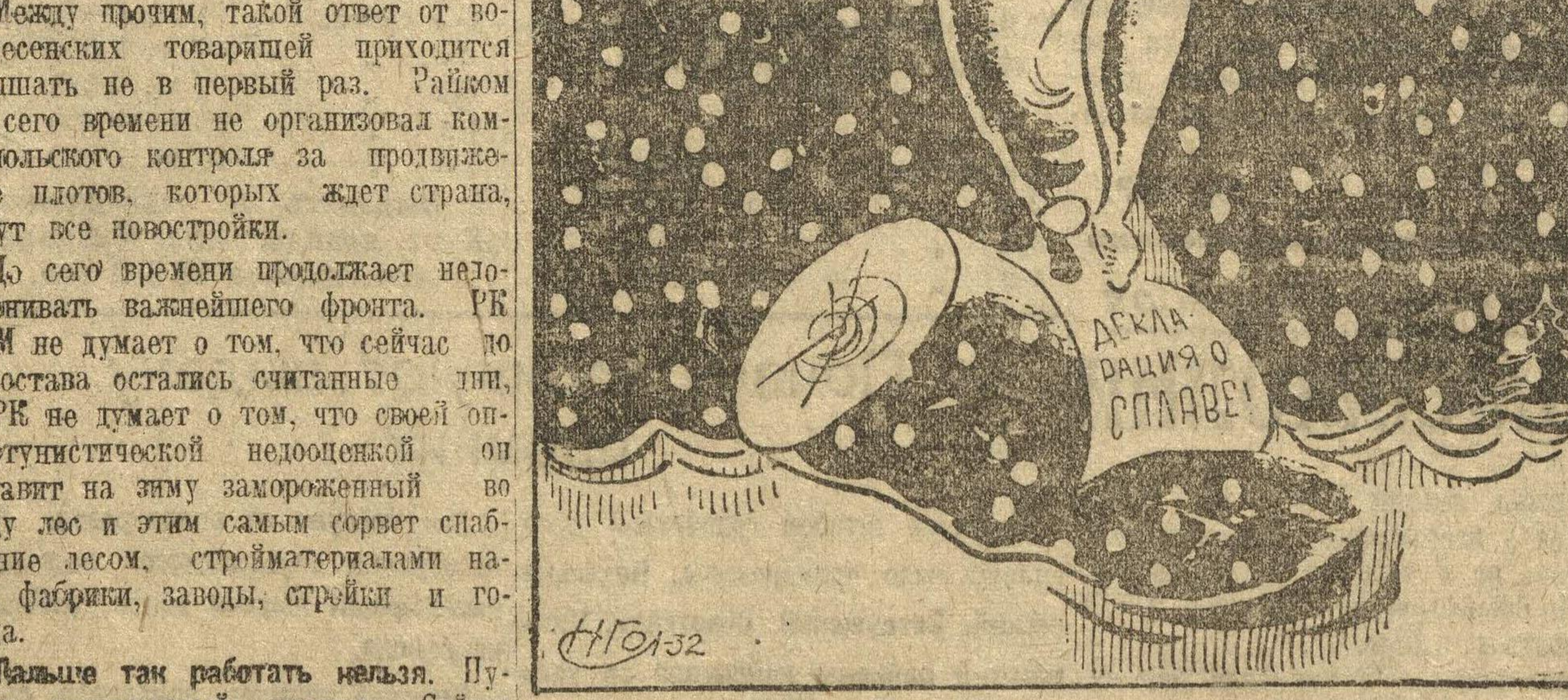
Попрыгунья-стрекоза лето красное пропела, оглянуться не успела, как зима катит в глаза.

Воскресенская попрыгунья-стрекоза. Сила — под угрозой сырья, а Воскресенский РК ВКП, вместо мобилизации масс комсомольцев, продолжает выносить декларации о силе, почему по существу не делал. Большая работа на фабрике Швейпрома № 2 проводится по улучшению бытовых условий молодежи. 10 комсомольцев назначены на продвижение в высшие разряды по зарплате, 4 из них уже продвинуты. Выявляются условия труда подростков. Ликвидирована практикующая на фабрике работа сверх норм. На 30 октября на фабрике полностью ликвидирована задолженность цеховых взносов. 100 проц. комсомольцев охвачены сберегательной кассой на 8 проц. к месячному заработку. 25 комсомольцев к XV годовщине Октября передали в ВКП(б), 22 ч. рабочей молодежи вступают в комсомол. Коллективом учтены все возможные участки комсомольской работы. Комсомольскими организациями Свердловского района есть чему поучиться у 2 фабрики Швейпрома. ЖЕГЛОВА.