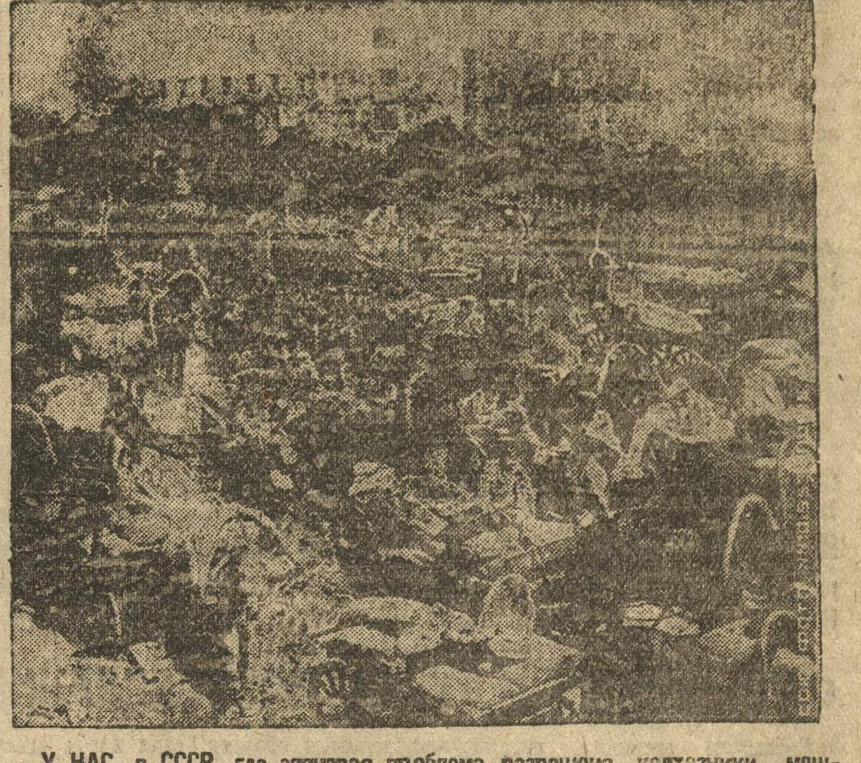
У НАС, в СССР, где разрешена проблема разорения, колхозники мощными красными обоями везут оболочечный хлеб на сытые пунты (Берисогейский район, ЦУО).

Свердловский РК ВЛКСМ, с целью вовлечения больших масс в демонстрацию Октябрьской годовщины, 6 ноября проводит карнавал. Во всех организациях проходят вечера, посвященные XV годовщине Октября; на них ставятся доклады о VI съезде партии, старые большевики выступают с воспоминаниями. 28-29 октября 20 человек комсомольского актива выехали на самозаготовку. В техникумах, ВУЗах организируются новые коммунны (фармацевтикум). На Телефонном комбинате организована новая хозяйственная бригада, с 10 ноября организируются среди молодежи комбината и по полноте идет проработка VI съезда ВКП(б). Трамвайщики выступили 2 новых комсомольских вагона. Организована группа ширпотреба. 10 комсомольцев передали в партию. 20 человек молодежи вступают в комсомол. Комсомольцы учебного комбината им. Ленина организовали дополнительный пех ширпотреба. Коллектив ВЛКСМ вагонно-ремонтного завода организовал комсомольский электросварочный пех. В школе ФЭУ организованы две хозяйственные, ударные молодежные бригады и намечено в организации еще две. Принято в комсомол 45 человек рабочей молодежи. Передано в партию 5 комсомольцев. Развернуто индивидуальное соревнование комсомольцев, с установкой: к XV годовщине Октября добиться охвата соревнованием 100 проц. комсомольцев. Заключено коллективное политсеты, с охватом 100 проц. комсомольцев политучебой. Бригада «Лен. Смель»: МАРИЯ БОСНЯК, КОСТИН