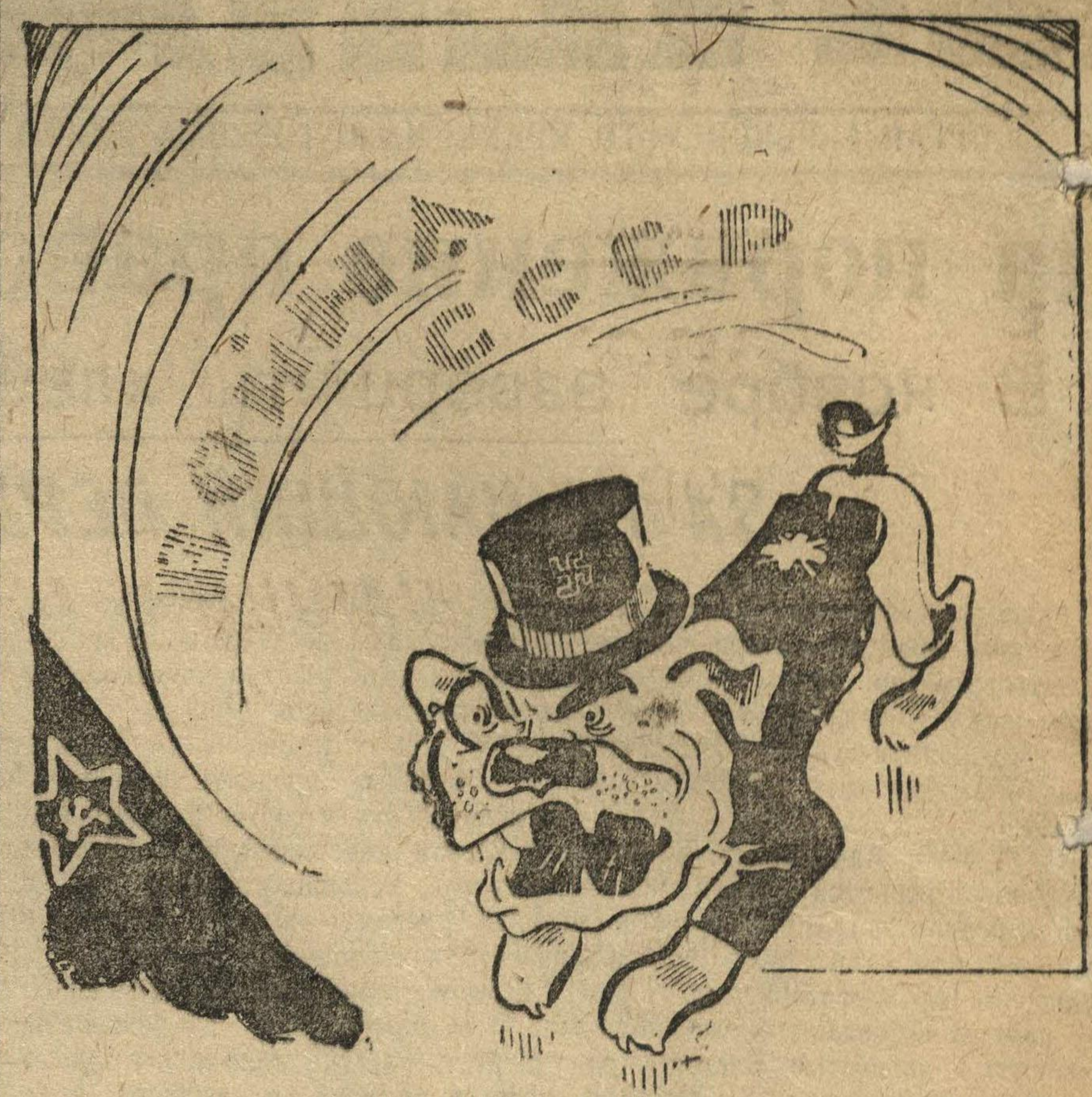
Рис. Н. Головина