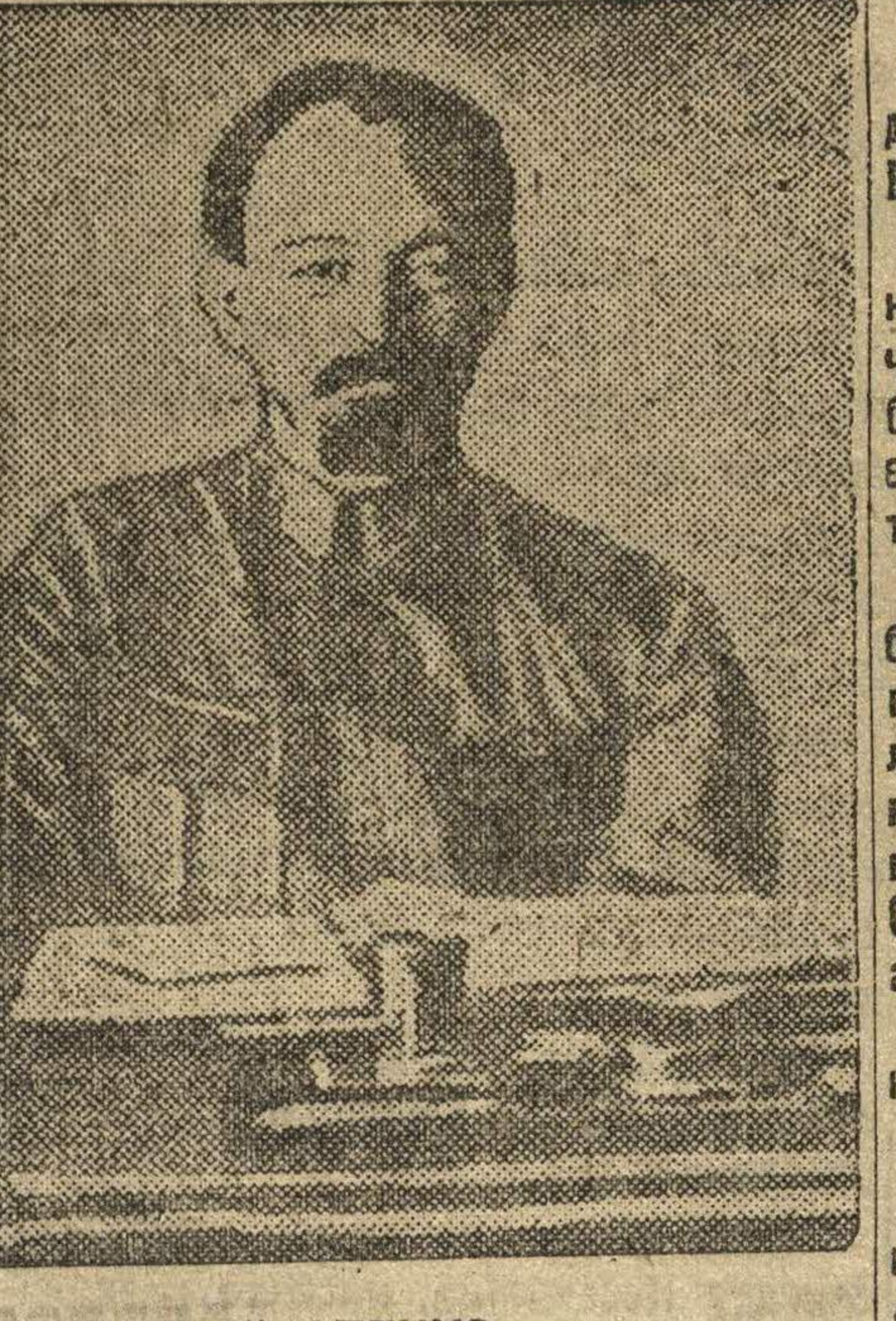
ЖЕЛЕЗНЫЙ ФЕЛИКС — организатор и руководитель ВЧК — ОГПУ.

Крайком ВКП(б) в день годовщины ОГПУ, шлет пламенный привет зоркому стражу диктатуры пролетариата — железной когорте чекистов Советского Союза и ее боевому Горьковскому отряду. В годы гражданской войны, в борьбе с вредителями, с саботажем классового врага, в реконструктивный период, ОГПУ сокрушало все присно врагов коммунизма, в течение 15 лет, высоко держа знамя пролетарской диктатуры. «ГПУ является грозой буржуазии, неуслышным стражем революции, обнаженным мечом пролетариата». (Сталин). Крайком ВКП(б) выражает уверенность, что и в дальнейшем железные отряды чекистов, верные славным большевистским традициям ВЧК и ее вождем Феликса Дзержинского, под руководством ленинского ЦК, во главе с тов. Сталиным еще более будут стоять на защите интересов пролетарской революции, сокрушая все попытки классовых врагов сорвать победоносное строительство социализма в СССР. Да здравствует XV годовщина одного из передовых отрядов пролетарской революции — ВЧК — ОГПУ! Да здравствует ВКП(б) и ее ленинский ЦК, во главе с тов. СТАЛИНЫМ! Да здравствует вождь и руководитель партии тов. Сталин!