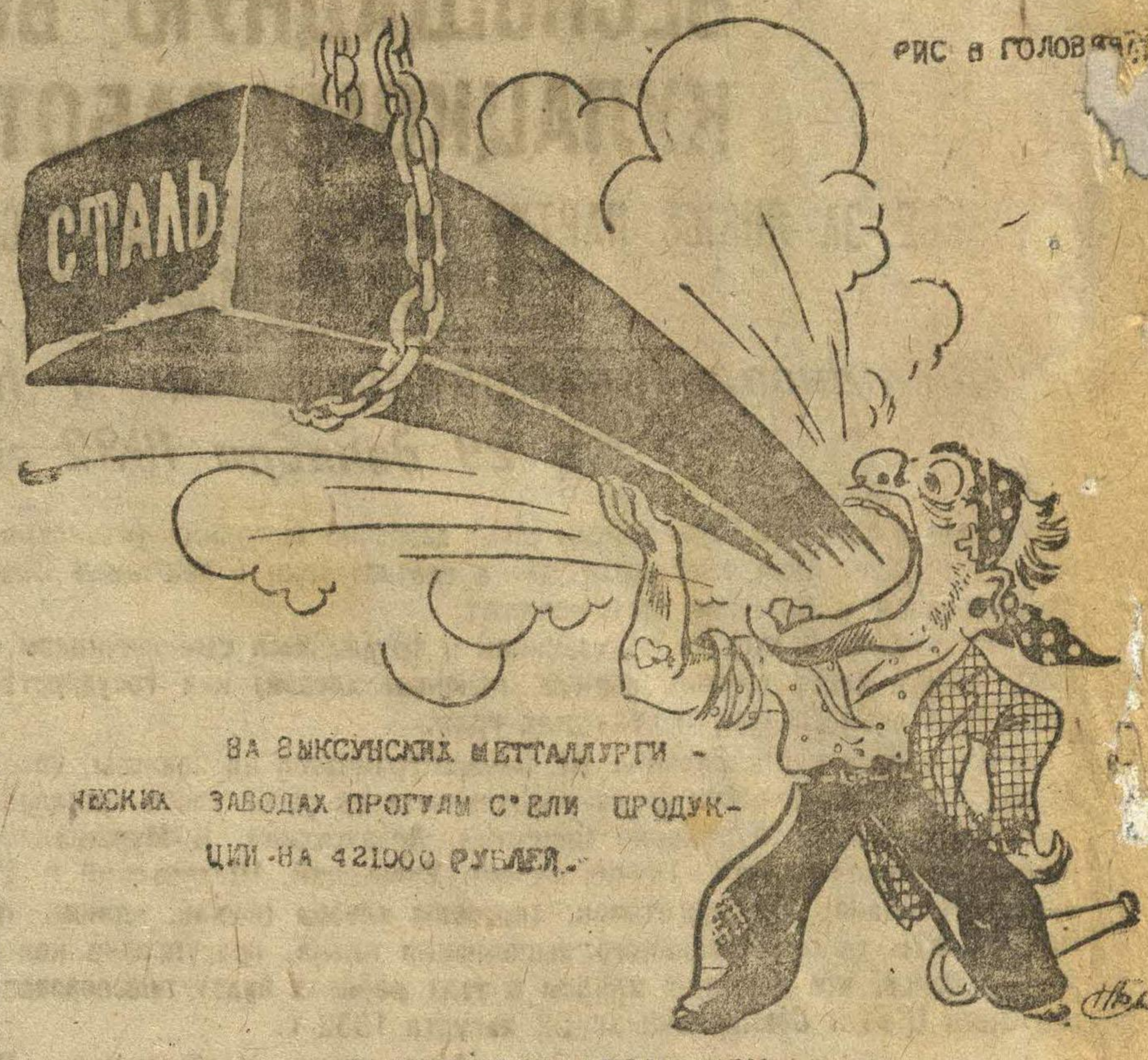
ВА ВЫПУСКСКИХ МЕТАЛЛУРГИЧЕСКИХ ЗАВОДАХ ПРОГУЛИ СЪЕЛИ ПРОДУКЦИЮ НА 421000 РУБЛЕЙ.