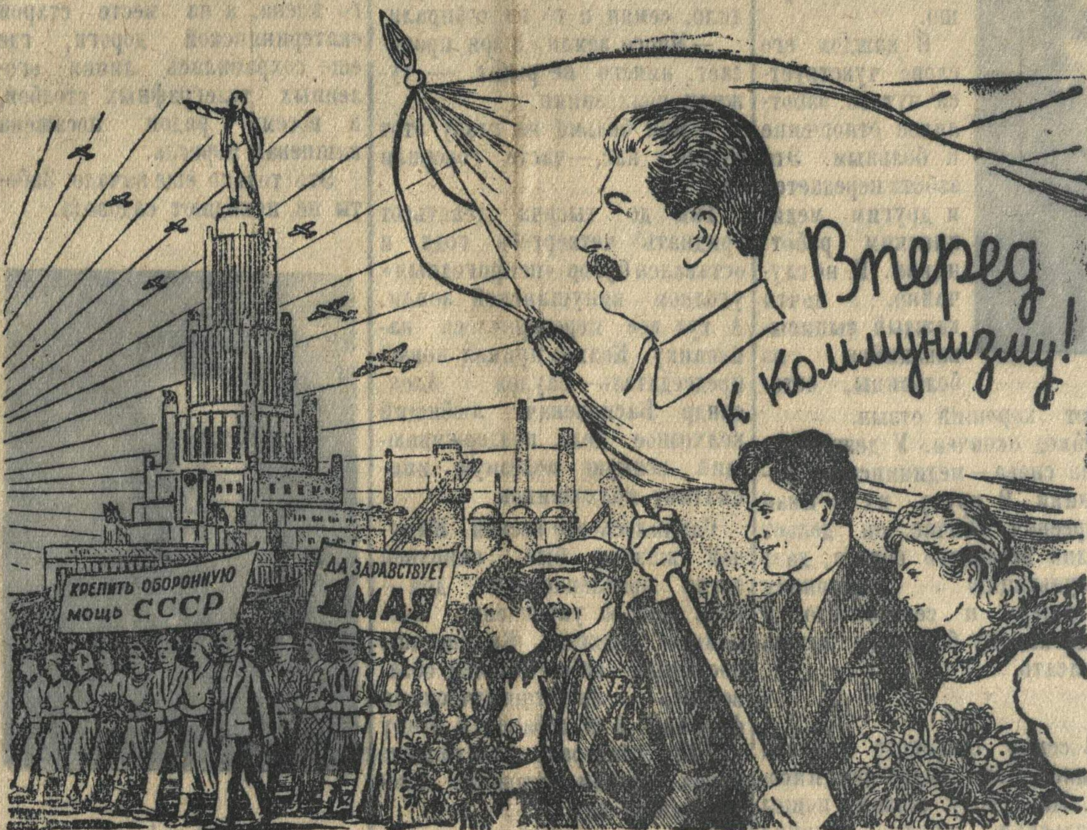
Рисунок Б. Уланова

Это наша святая обязанность перед советским народом, перед трудящимися всего мира.