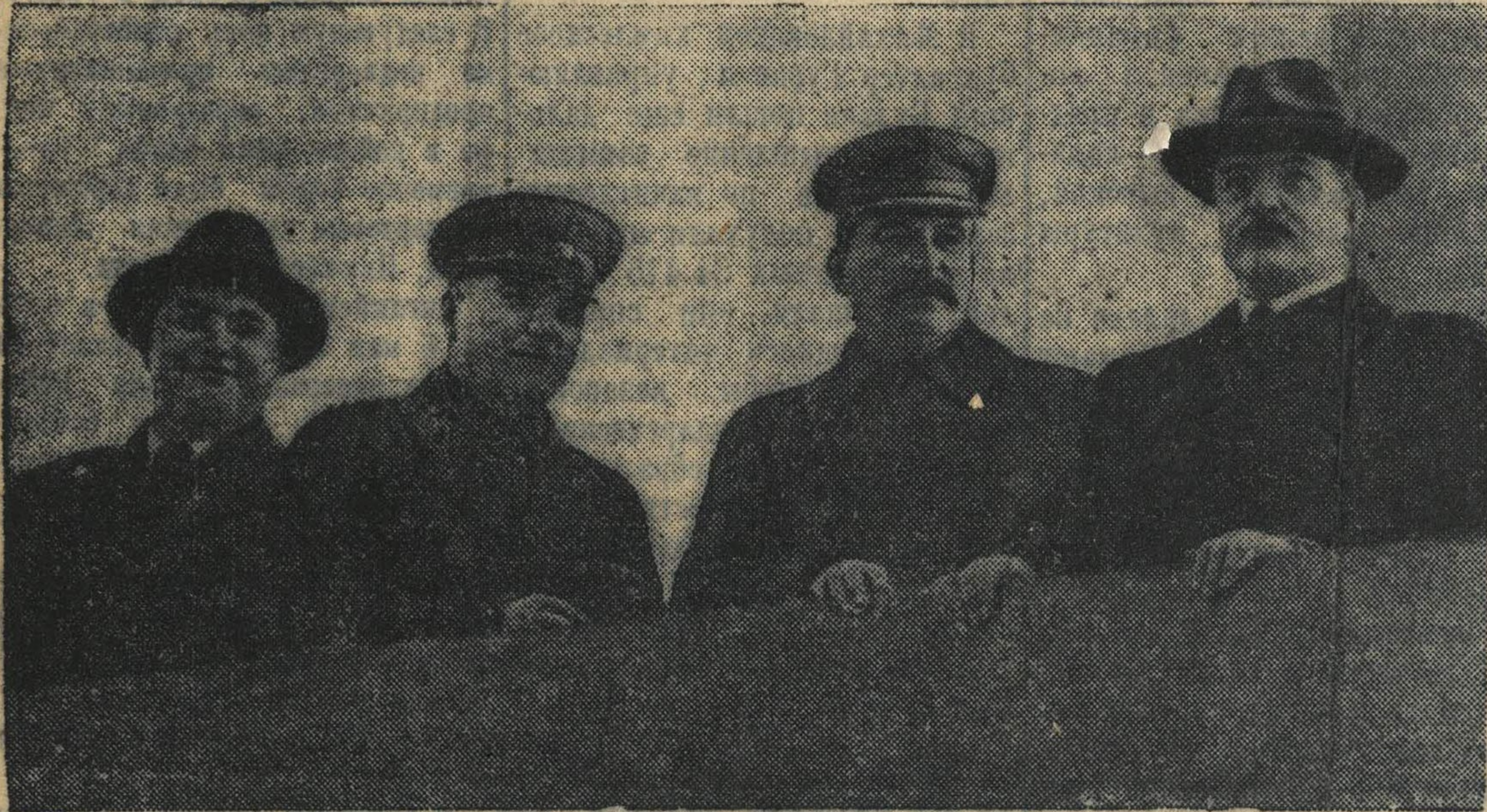
Празднование 1-го Мая в Москве. Справа налево: товарищи В. М. Молотов, И. В. Сталин, К. Е. Ворошилов и Г. М. Димитров на трибуне мавзолея.

БЫСТРО И ПРИ ВЫСОКОМ КАЧЕСТВЕ ЗАВЕРШИМ ВЕСЕННИЕ РАБОТЫ НА КОЛХОЗНЫХ ПОЛЯХ И В САДАХ!