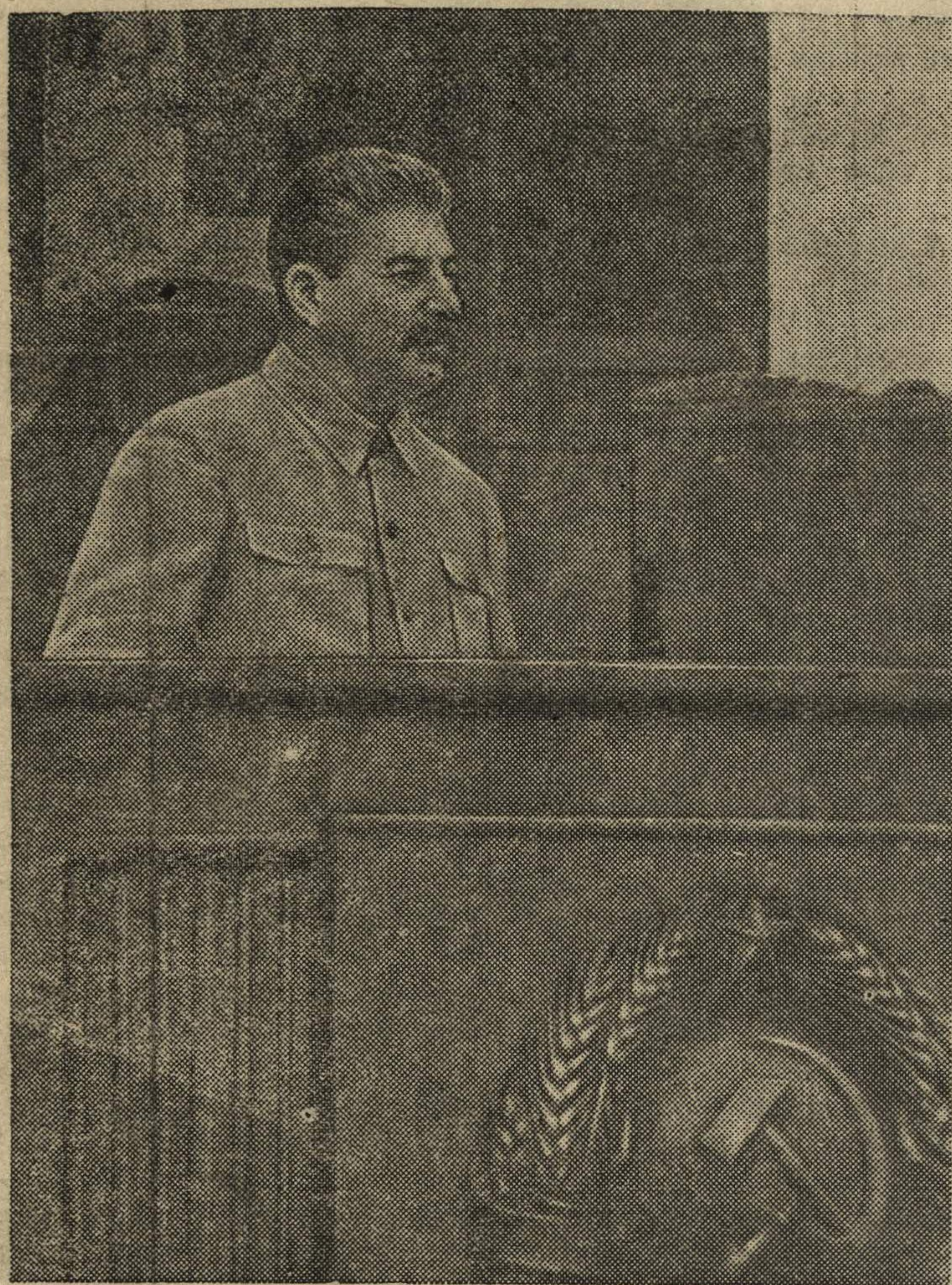
ТОВАРИЩ И. В. СТАЛИН.

Герб СССР из русских самоцветов, предназначенный для павильона «Ленинград—Северо-Восток РСФСР» Всесоюзной сельскохозяйственной выставки, 17 мая отправлен в Москву.