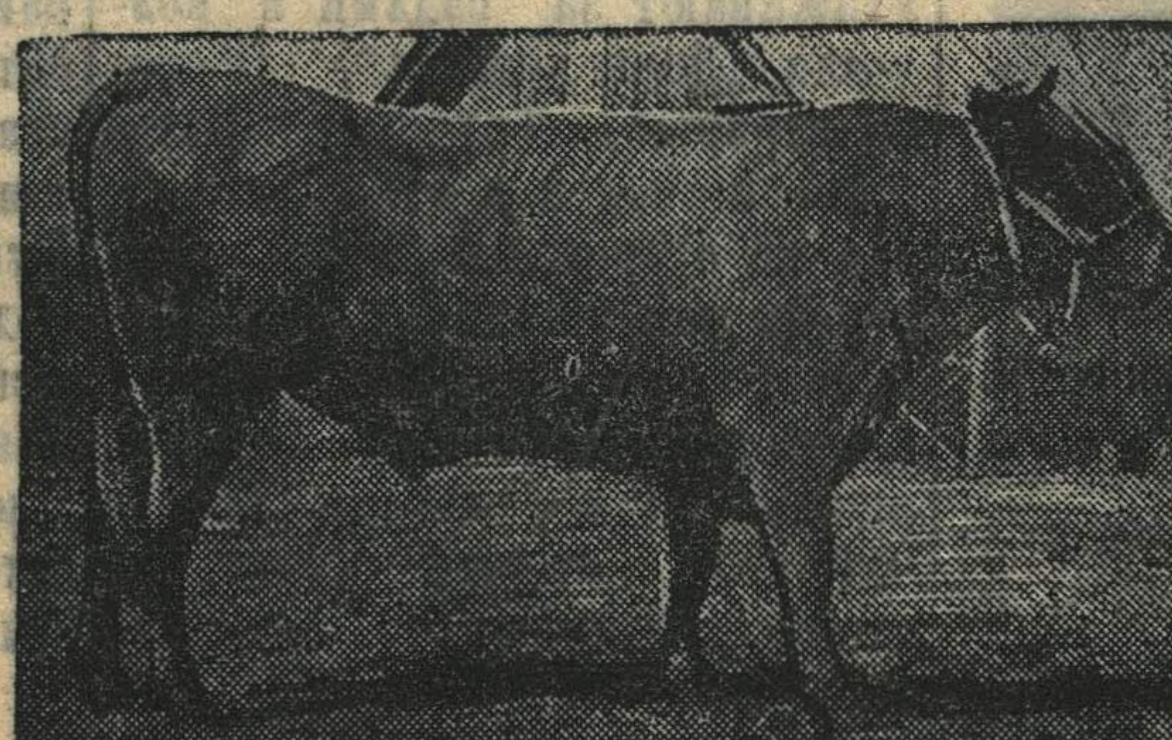
Бык „Бойкий“ (Отарская МТФ), находящийся сейчас в Москве для показа на ВСХВ.

СПОРТИВНЫЙ ГОРОДОК По инициативе коммунистов и комсомольцев с. Белавки на площади у здания сельского совета построен спортивный городок, где установлены шесть, лестницы, трапеция, турник, веревочная лестница, кольца. Устроена также волейбольная площадка. К.