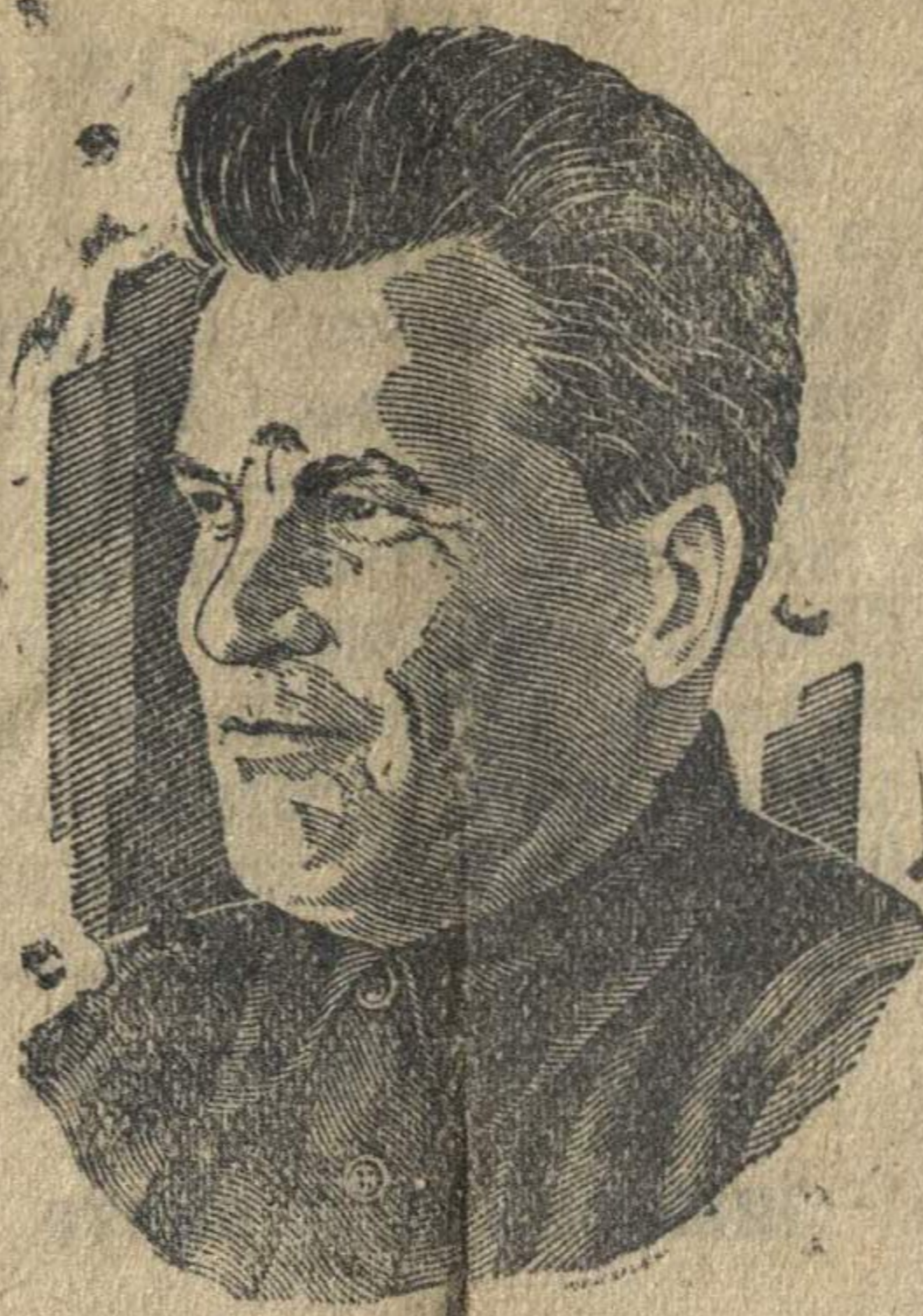
Сергей Миронович Киров.