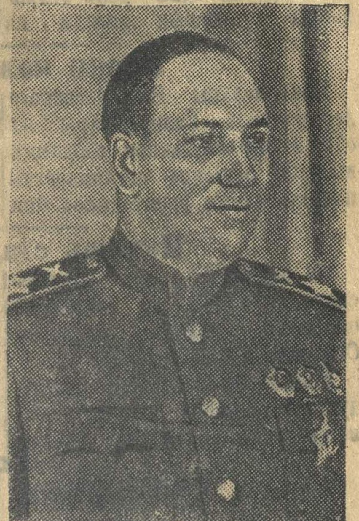
Маршал артиллерии Н. Н. ВОРОНОВ.