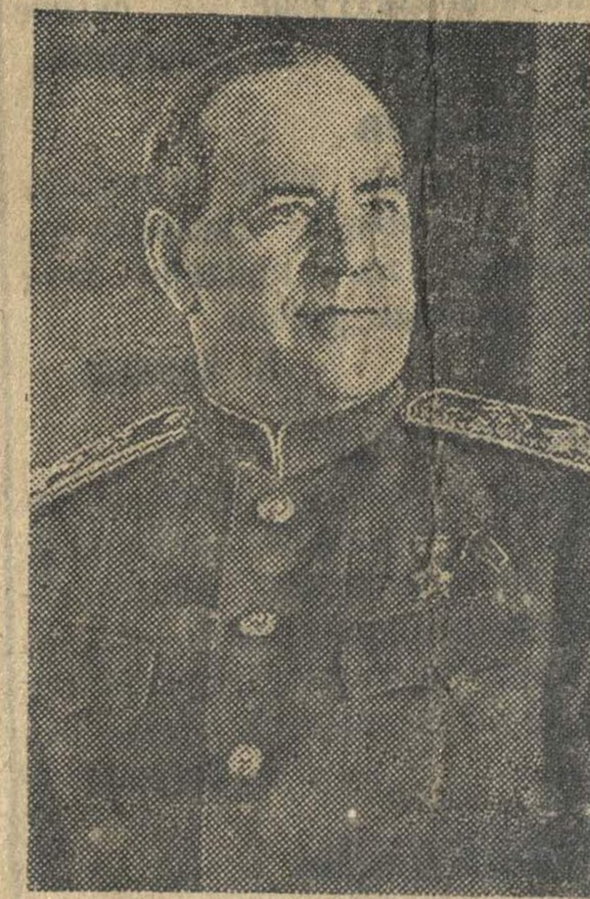
Маршал Советского Союза Г. К. ЖУКОВ.