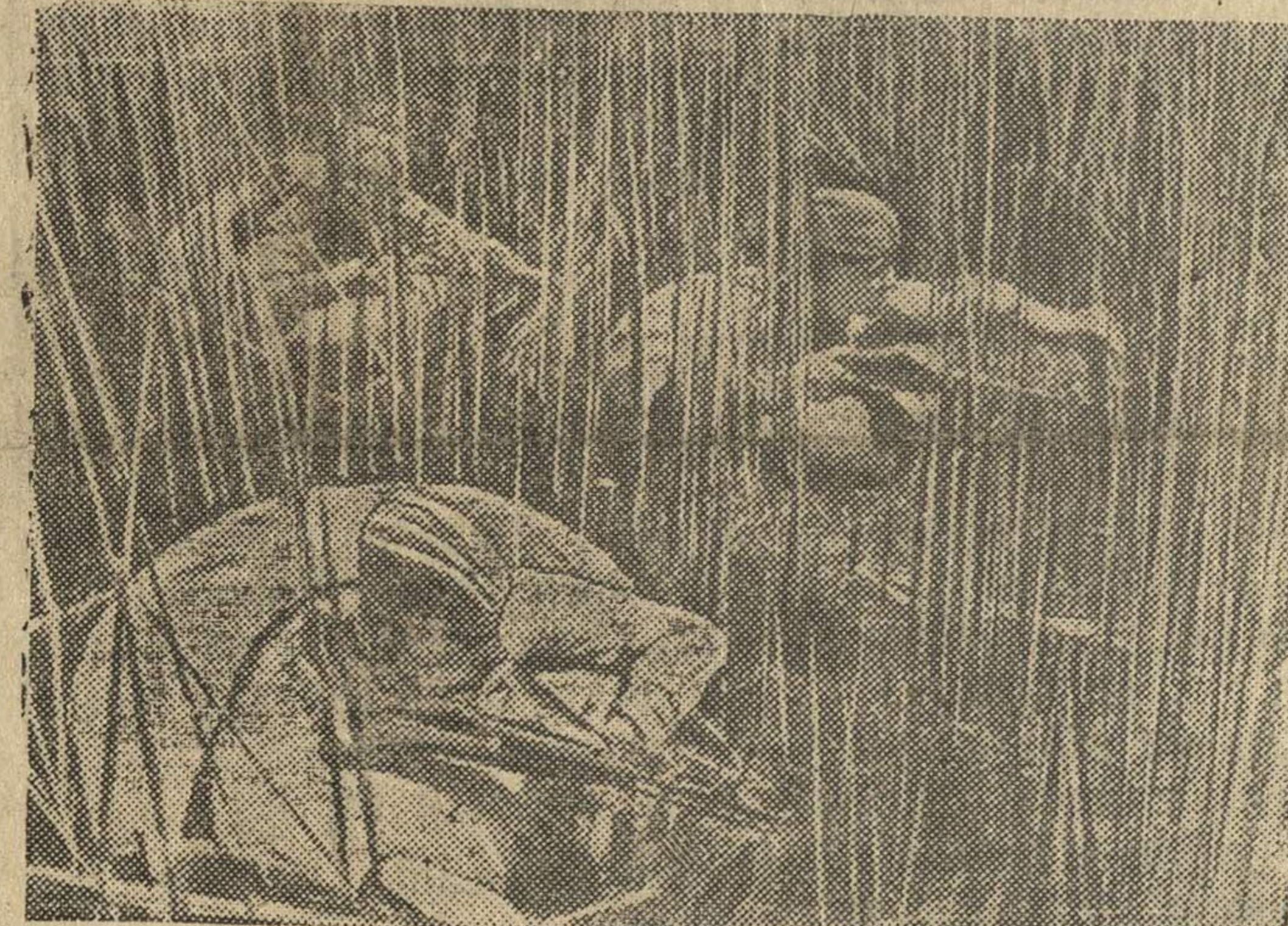
(В плавнях Кубани).

На снимке: Разведчики орденосец Гандрохимов, Гацаев и Лунев отправляются в специальном снаряжении на боевое задание.