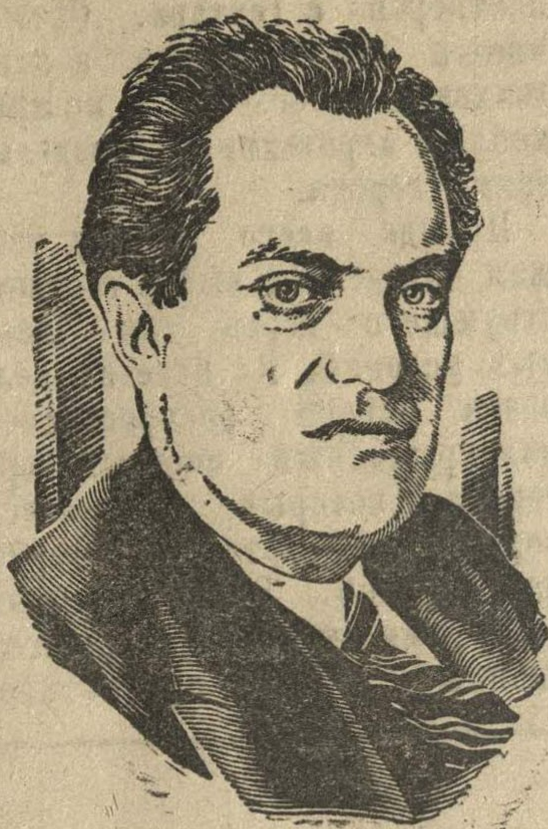
В. В. Куйбышев.

25 января 1941 г. исполнилось 6 лет со дня смерти пламенного большевика, верного соратника Ленина и Сталина Валериана Владимировича Куйбышева, злодейски убитого троцкистско-бухаринской бандой врагов народа.