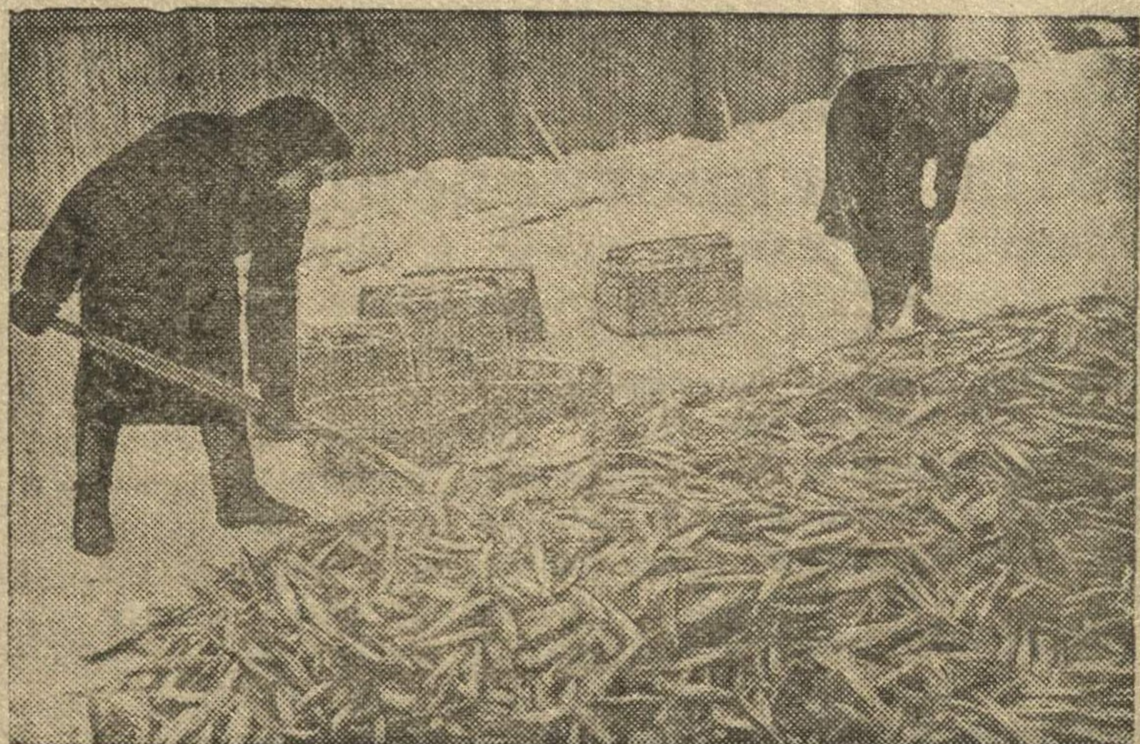
Работницы Беломорского рыбозавода (Карело-Финская ССР) убирают сельди.