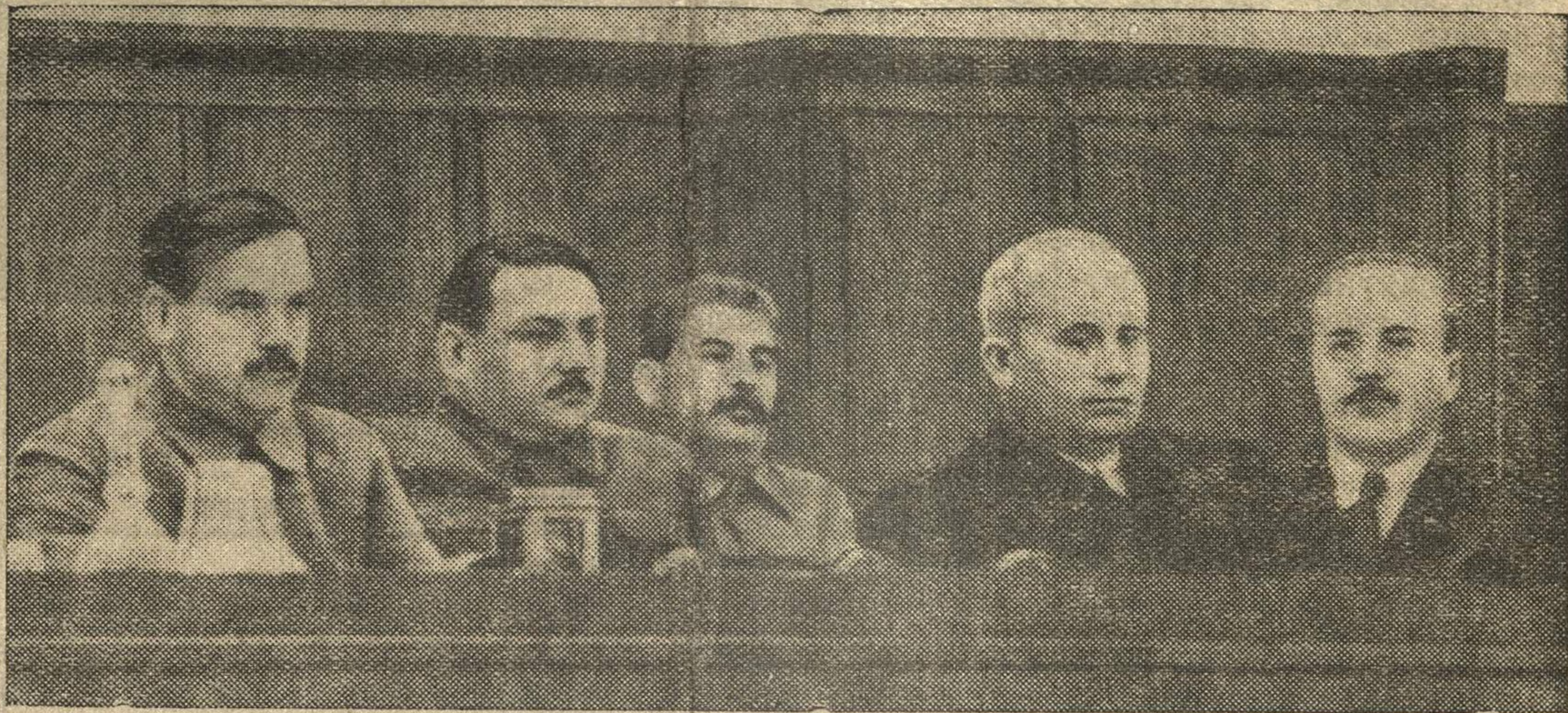
Товарищи А. А. Андреев, А. А. Жданов, И. В. Сталин, Н. С. Хрущев и В. М. Молотов в президиуме конференции.