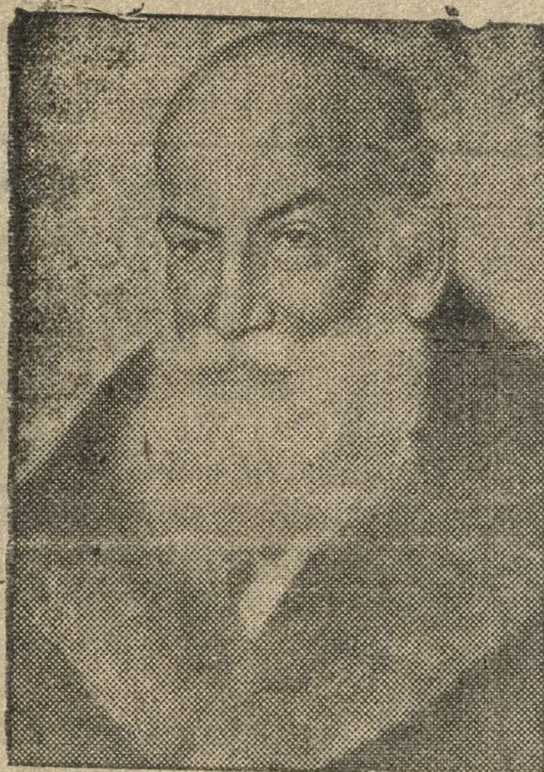
Н. Е. Жуковский

17 марта исполняется 20 лет со дня смерти ученого с мировым именем «отца русской авиации» Н. Е. Жуковского — основателя Военно-Воздушной Академии в Москве.