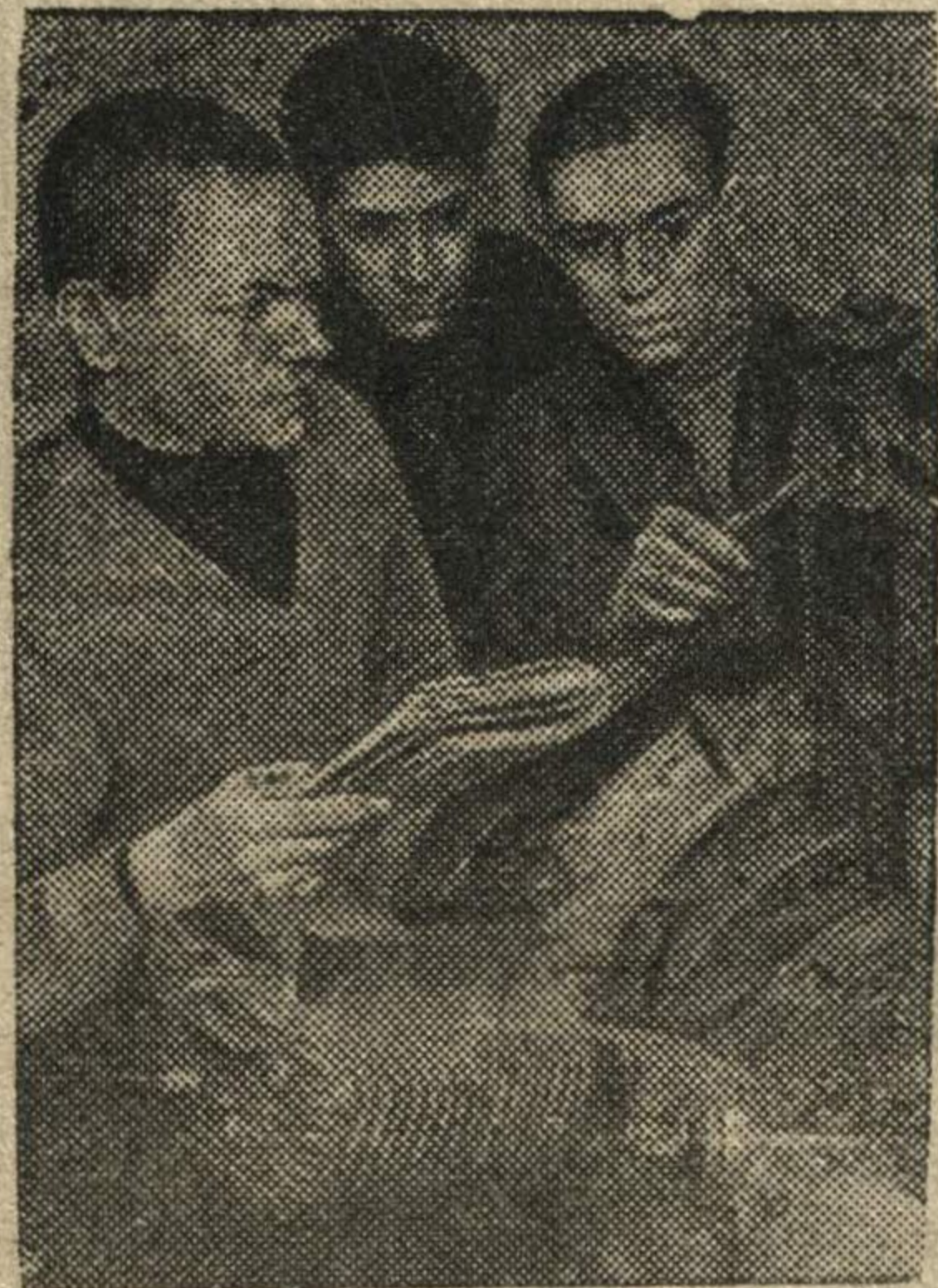
Призывники знакомятся с устройством мотора самолета.