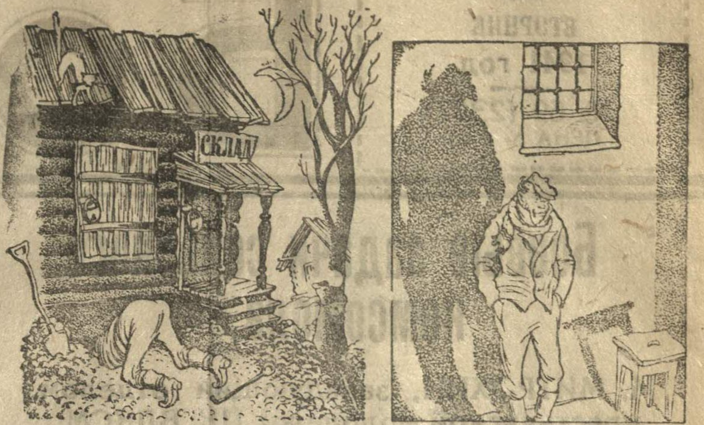
Шел в комнату...

Участь расхитителя общественной собственности