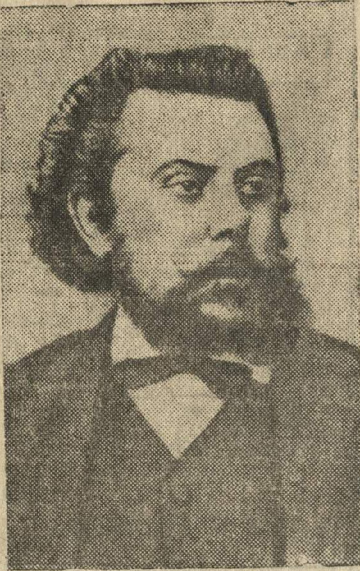
М. П. Мусоргский.

28 марта исполнилось 60 лет со дня смерти гениального русского композитора М. П. Мусоргского.