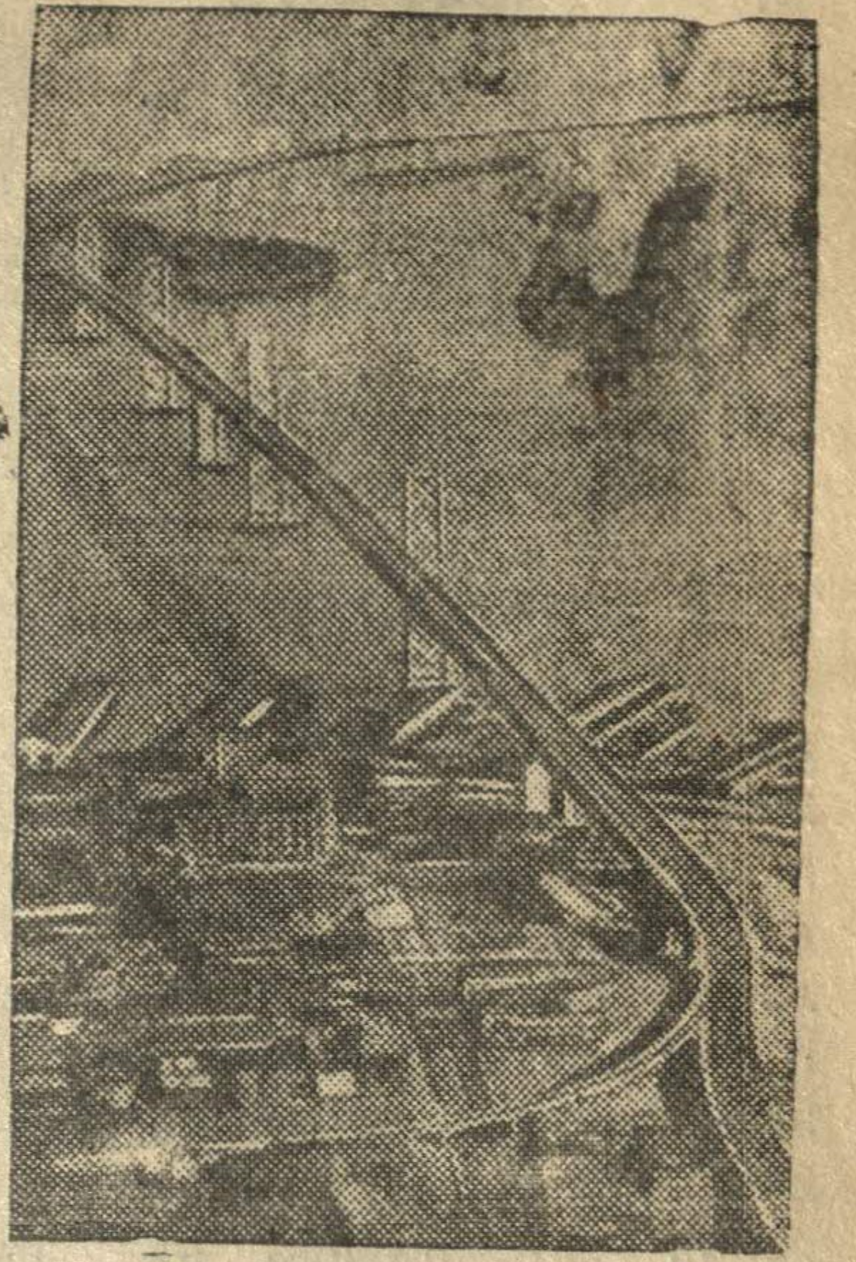
Мост в Сан-Франциско (США) длиной около 13,6 километра.