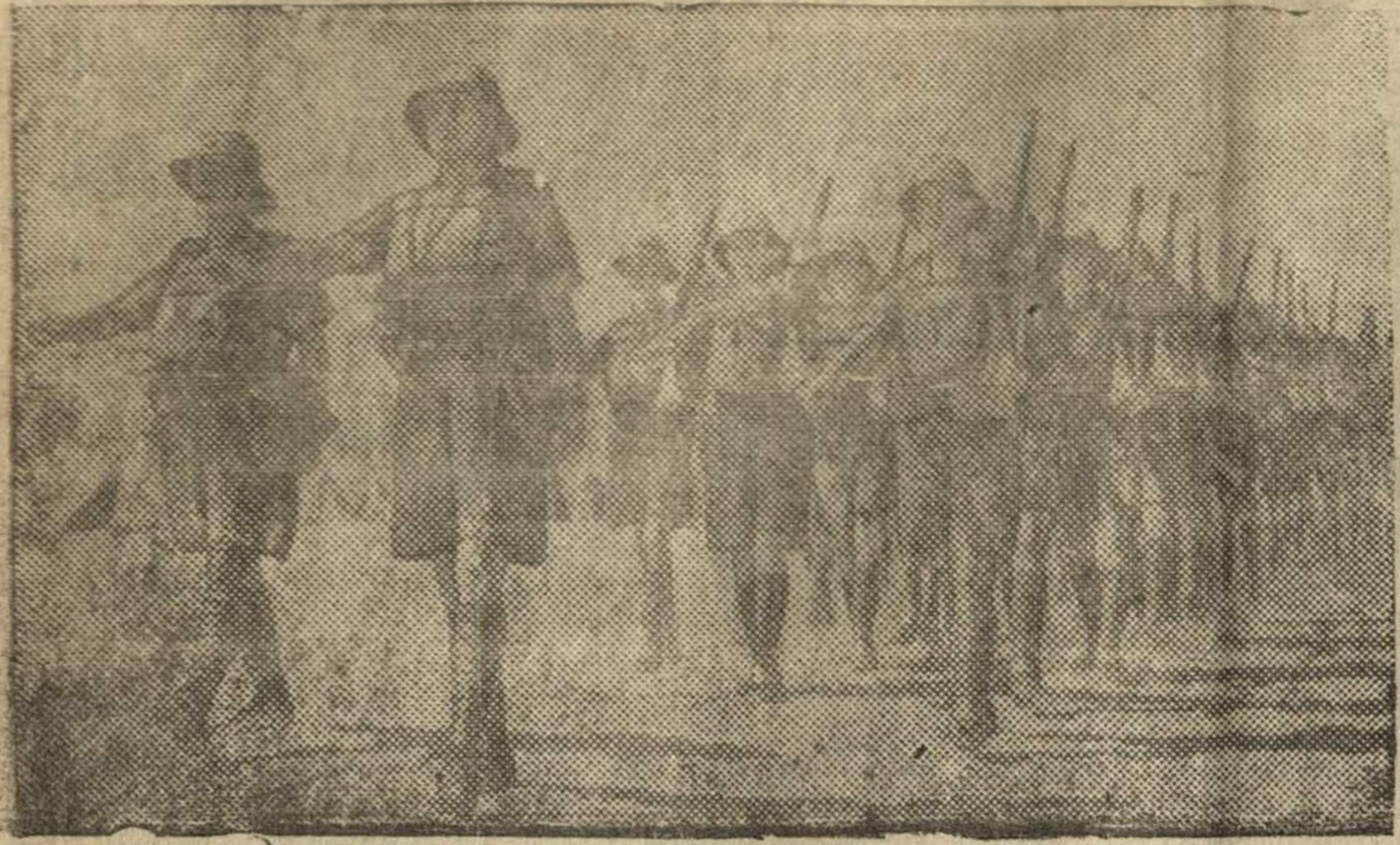
Английские войска на фронте в Западной пустыне (Африка)