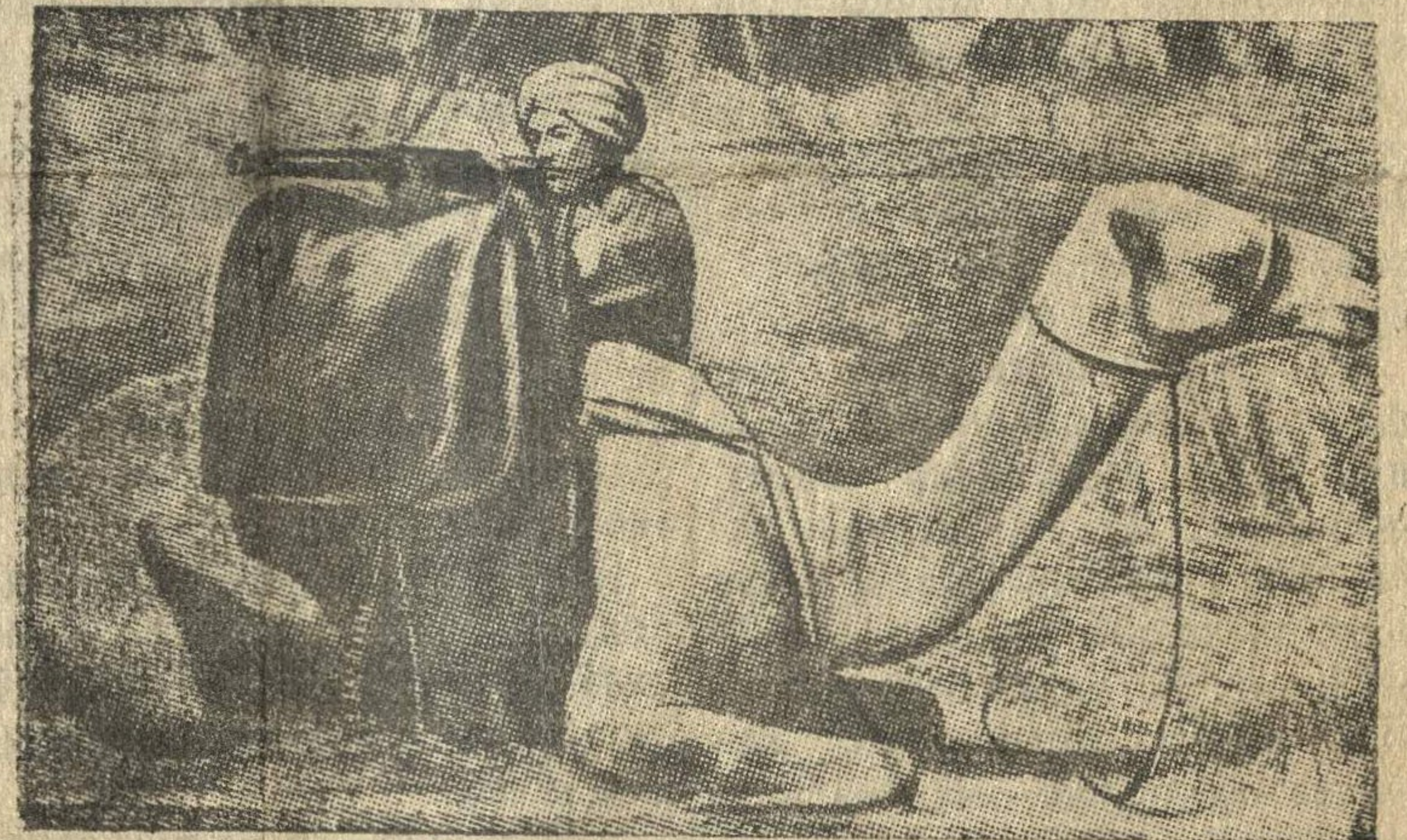
Верблюжий дозор суданских войск на эритрейской границе.