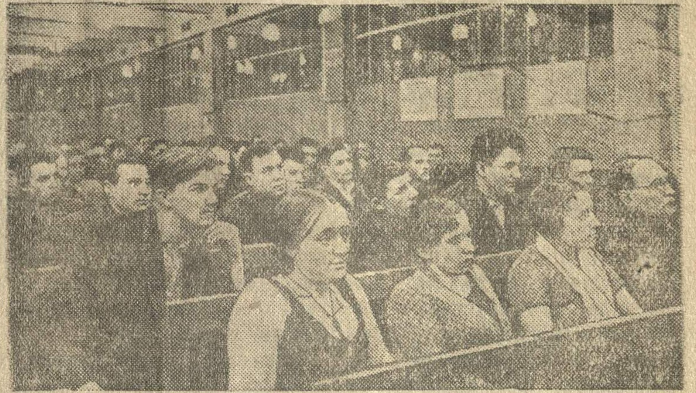
Партсобрание в литейном цехе № 3.

Отчетно-выборные собрания цеховых партийных организаций на заводе имени Сталина (Москва)