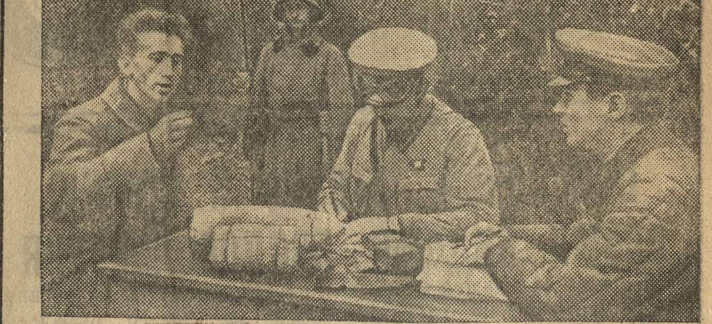
Допрос пленного немецкого солдата в штабе.

Большое подмосковное село Верею (ныне районный центр) Наполеон хотел превратить в базу для своих действий против партизан и начал укреплять его. Партизанский отряд под командой Дорохова внезапно напал на Верею и, пе-