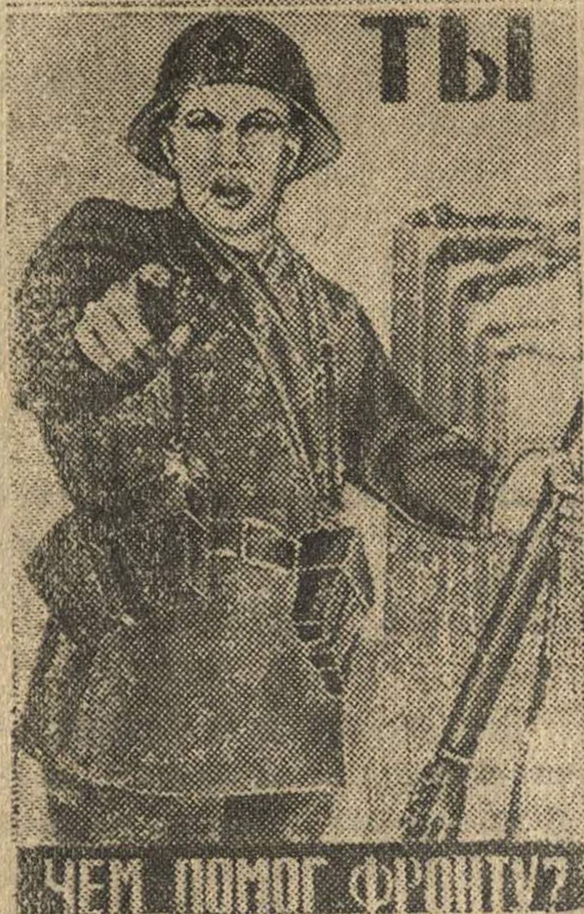
Рисунок художника Моор. (Репродукция с плаката, выпускаемого издательством «Искусство».)