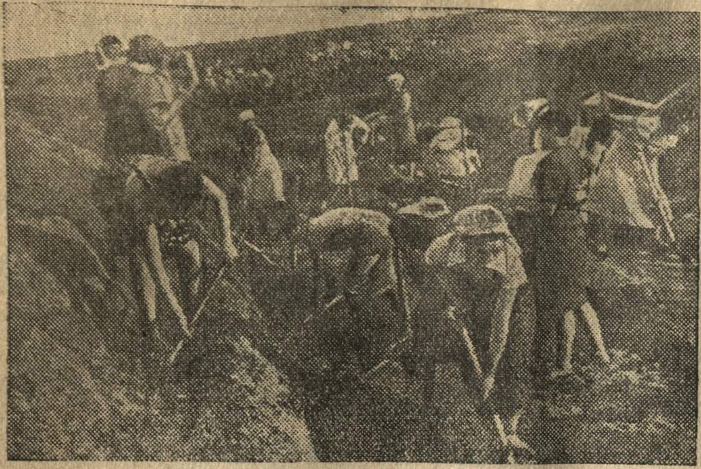
Население роет противотанковые рвы.