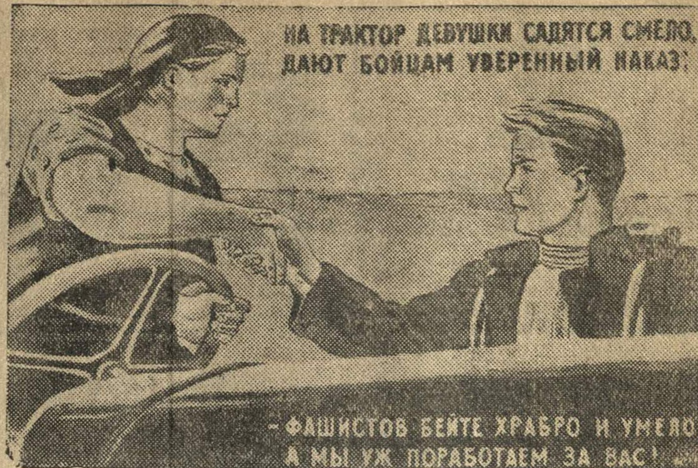
Рисунок Т. Ереминой.

(Репродукция с плаката, выпускаемого издательством «Искусство».)