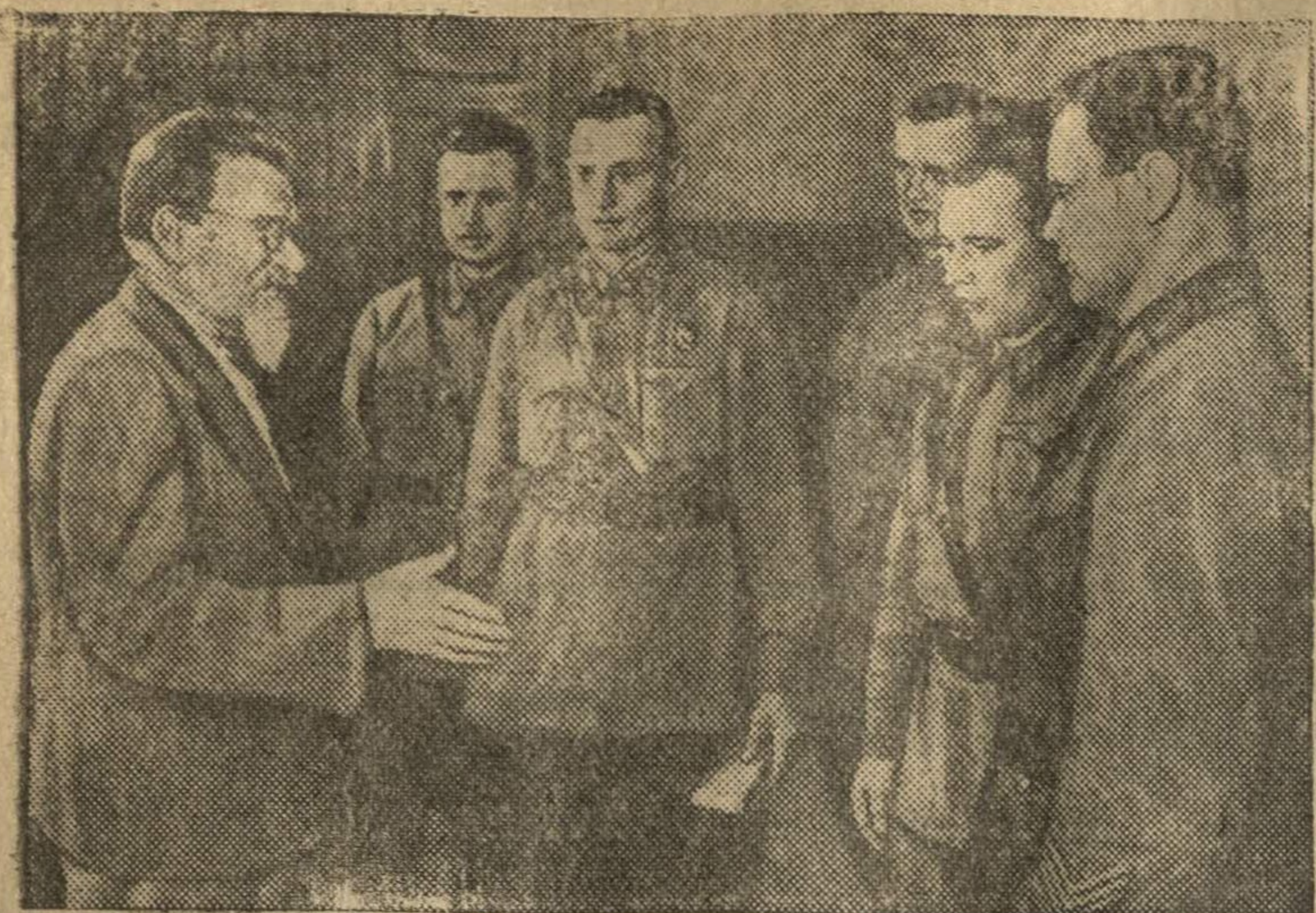
Товарищ М. И. Калинин беседует в Кремле с героями летчиками, награжденными орденами и медалями СССР за образцовое выполнение боевых заданий Командования на фронте борьбы с германским фашизмом и проявленные при этом доблесть и мужество.