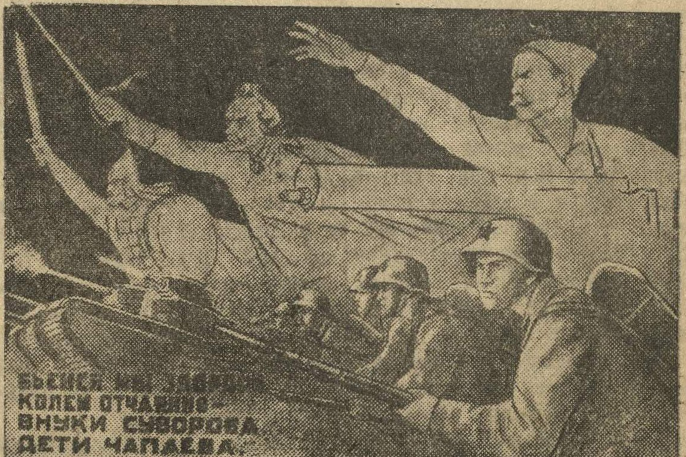
Рисунок художников Кукрынижес. Текст С. Маршака. (Репродукция с плаката, выпускаемого издательством «Искусство»).