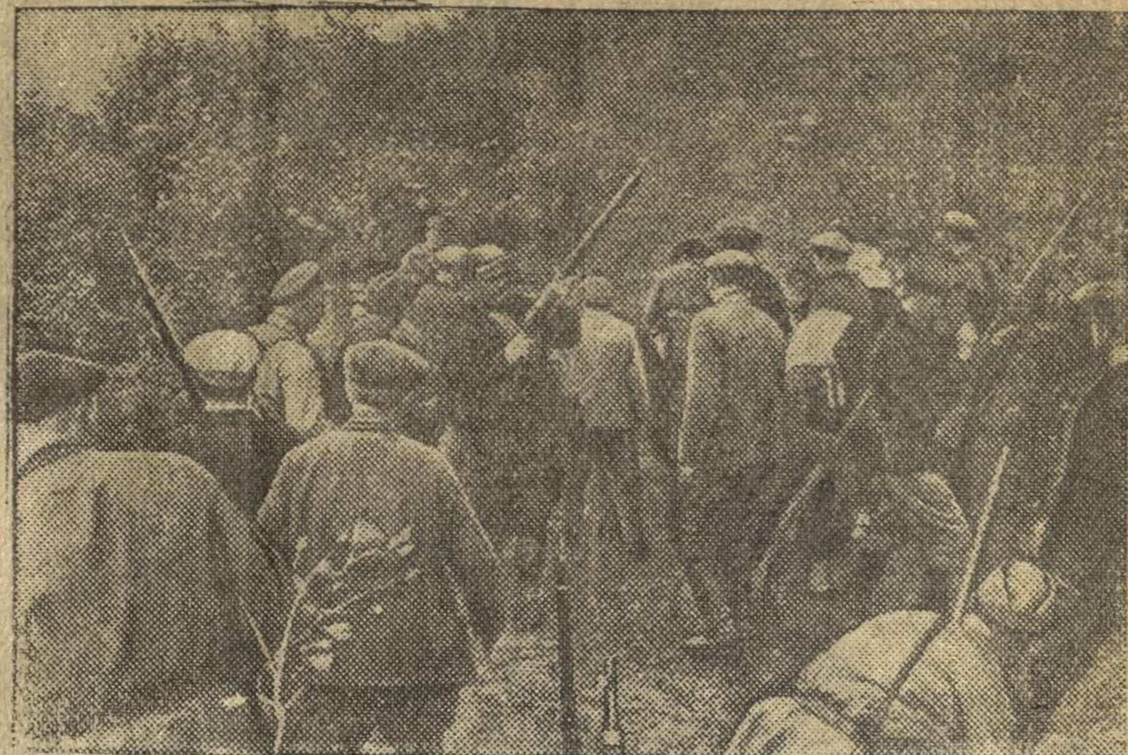
Партизаны вновь организованного отряда получают оружие.