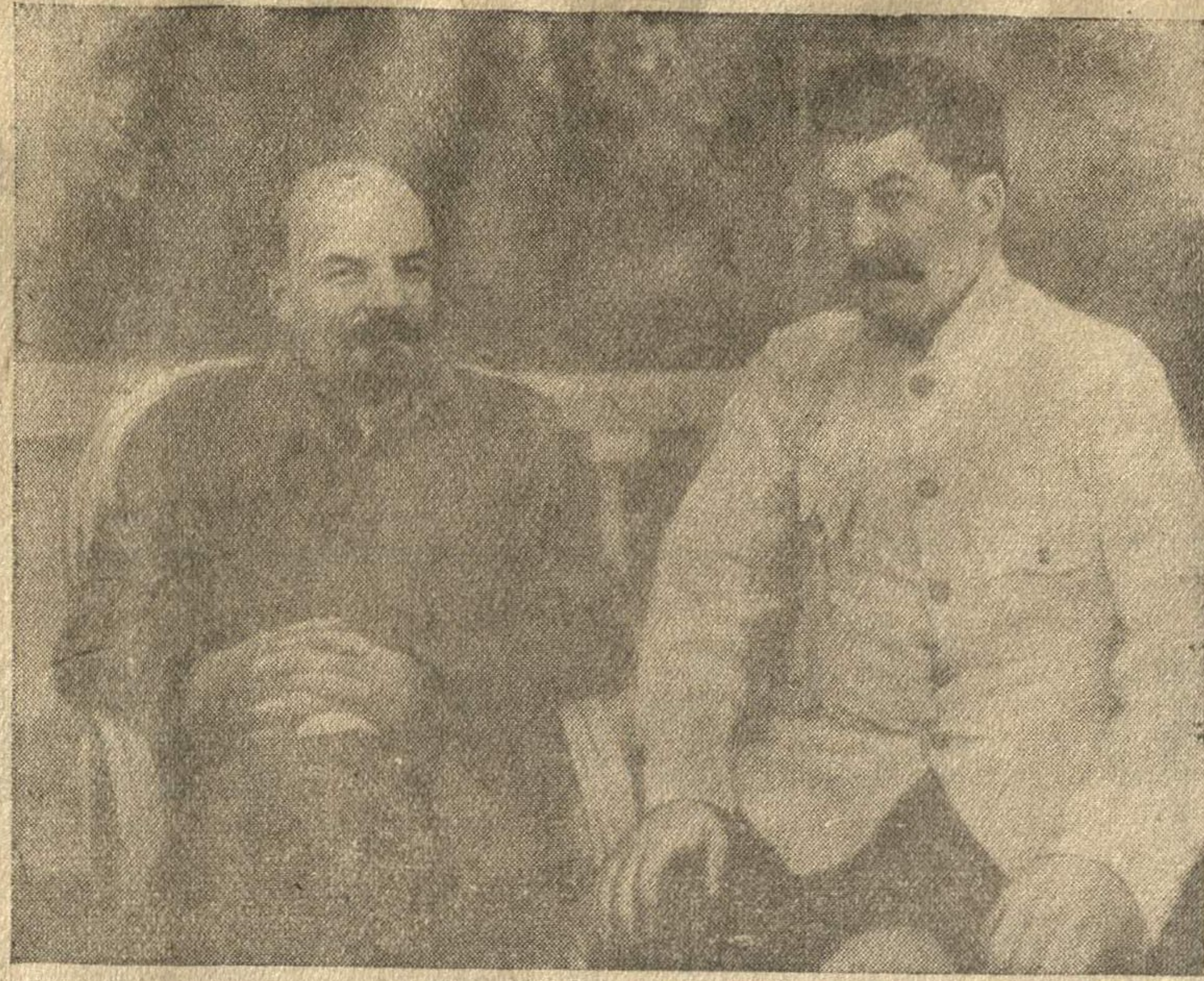
В. И. Ленин и И. В. Сталин в Горках.

Возле Петровац произошел 3-дневный бой югославских партизан с итальянской частью. Итальянцы отступили, потеряв убитыми 114 солдат.