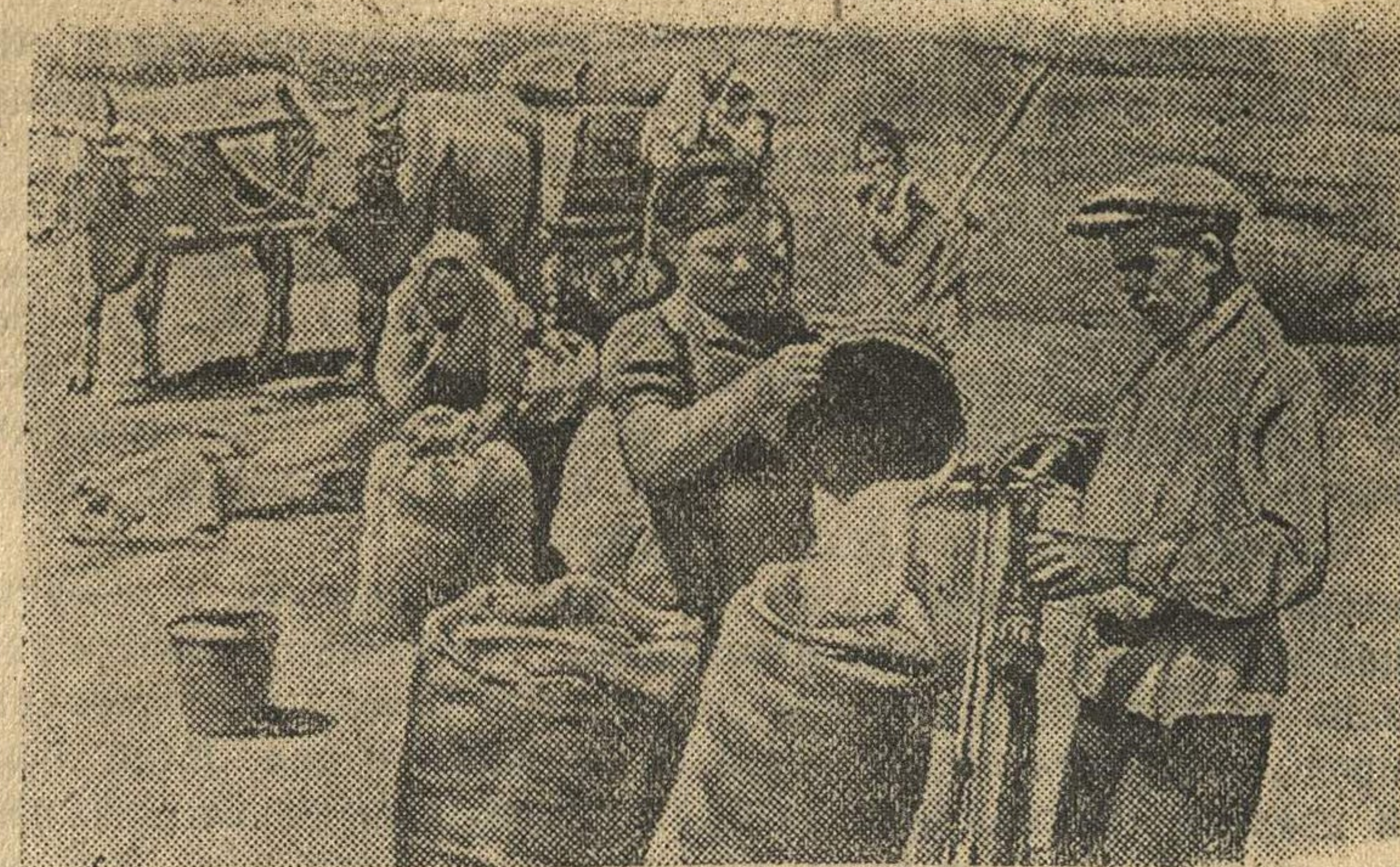
На току колхоза „Завоевания Октября“ (Сталинградская область) взвешивают зерно перед отправкой на сыпной пункт.

Южнее города Жэшув наши войска вели наступательные