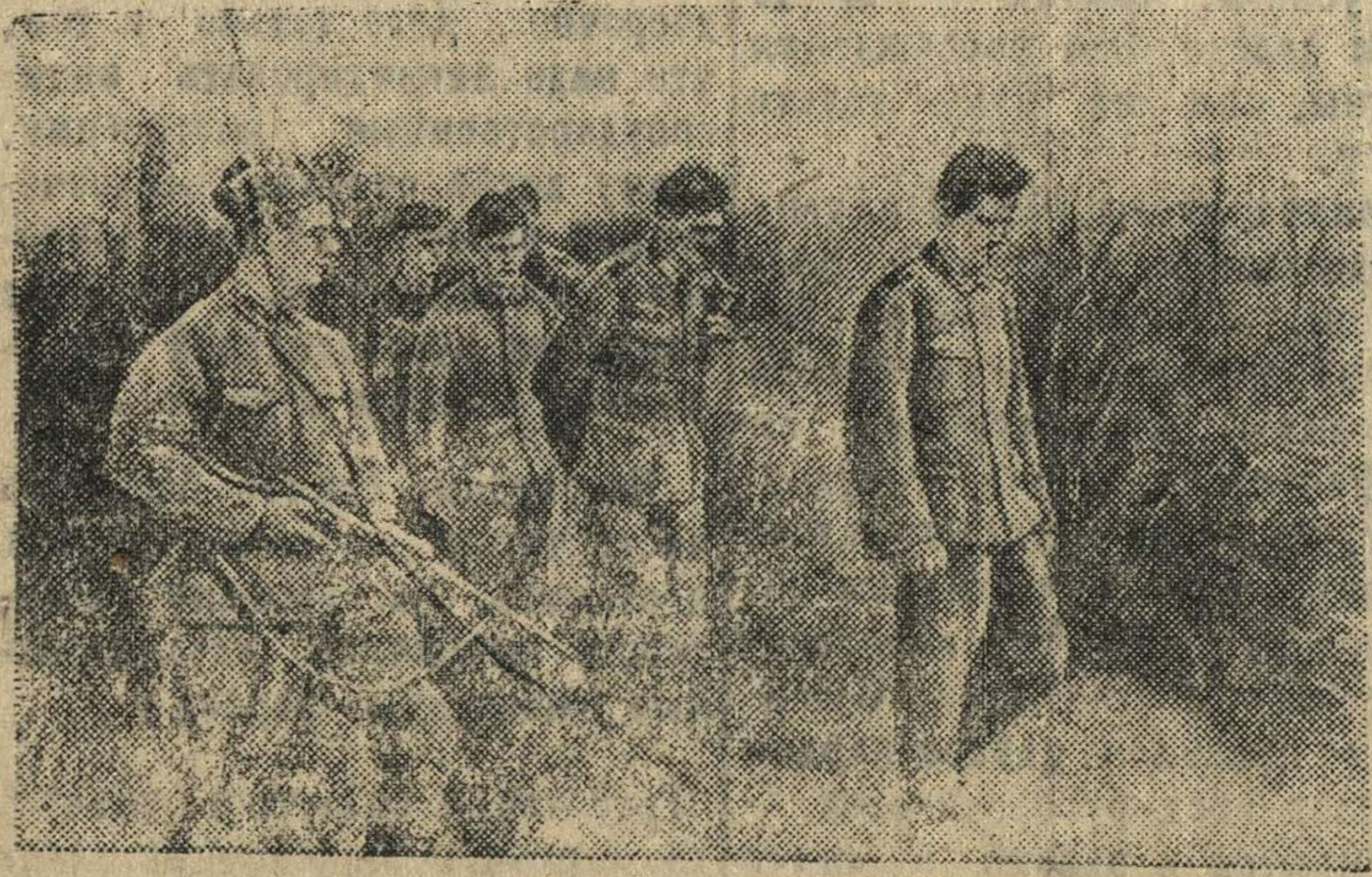
Группа гитлеровцев, захваченных в плен, направляется в тыл.