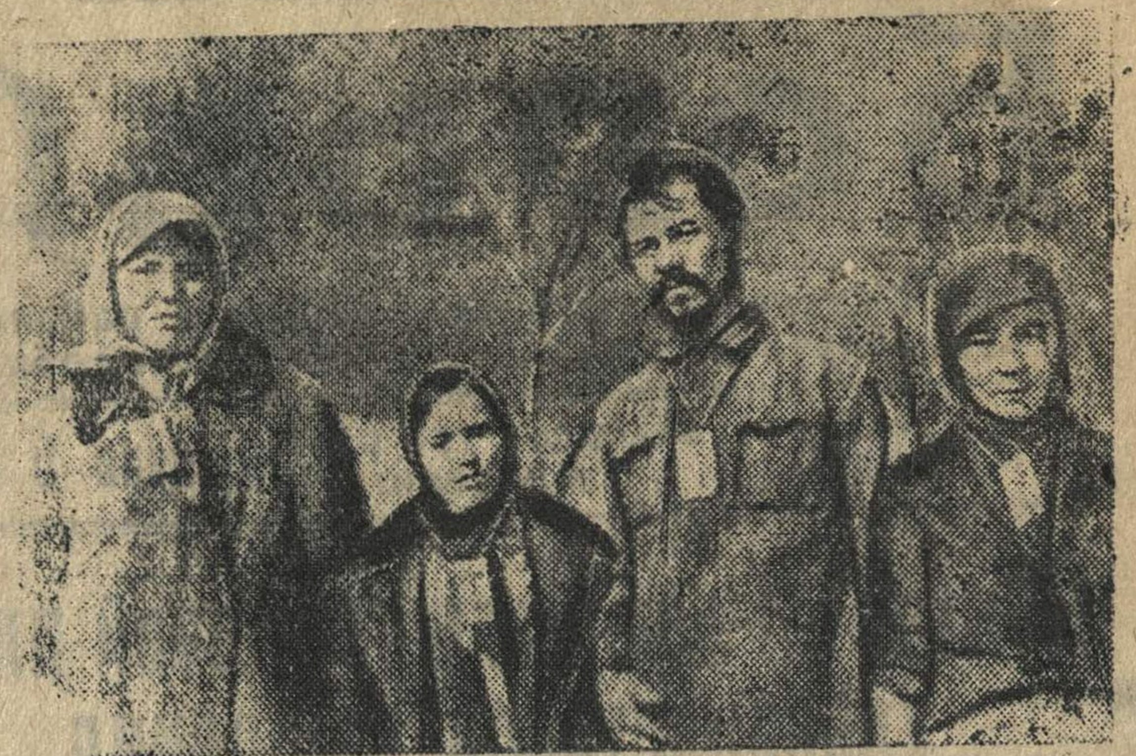
Во время оккупации деревни Рыльцово Зубцовского района Калининской области немецкие изверги, угрожая расстрелом, заставляли советских граждан носить на шее бирки.

ЛОНДОН, 28 сентября. (ТАСС). Как передает агентство Рейтер, казнь 800 югославов, захваченных немцами и итальянцами во время боев в Боснии, усилила ненависть населения к захватчикам. В последние дни замечается новая волна саботажа на железных дорогах. По сообщениям из Загреба, хорватские власти отдали приказ, согласно которому после уборки урожая все стебли кукурузы на полях, расположенных по обе стороны железнодорожных линий, должны быть срезаны на пространстве в 200 метров. Крестьянам не подчиняющимся приказам, таким образом, представляющим повстанцам возможность скрываться в полях, угрожает смертная казнь. Для того, чтобы предупредить саботаж, изданы самые решительные приказы о движении близ железных дорог. 16 деревень Словении, занятых немцами, стерты с лица земли, а 165 тыс. словен высланы. Итальянцы сравняли с землей 42 деревни близ железных дорог и выслала 70 тыс. человек.