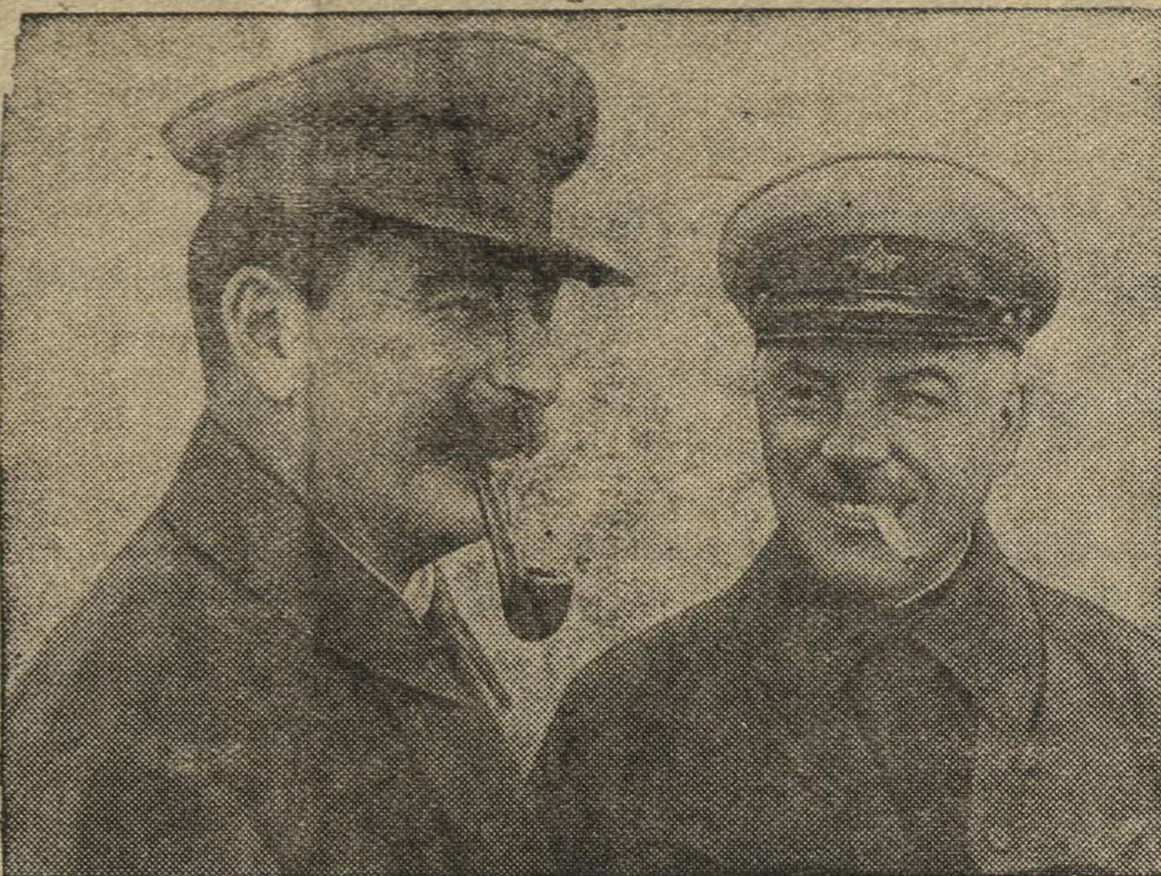
На снимке товарищи: И. В. Сталин и К. В. Ворошилов.