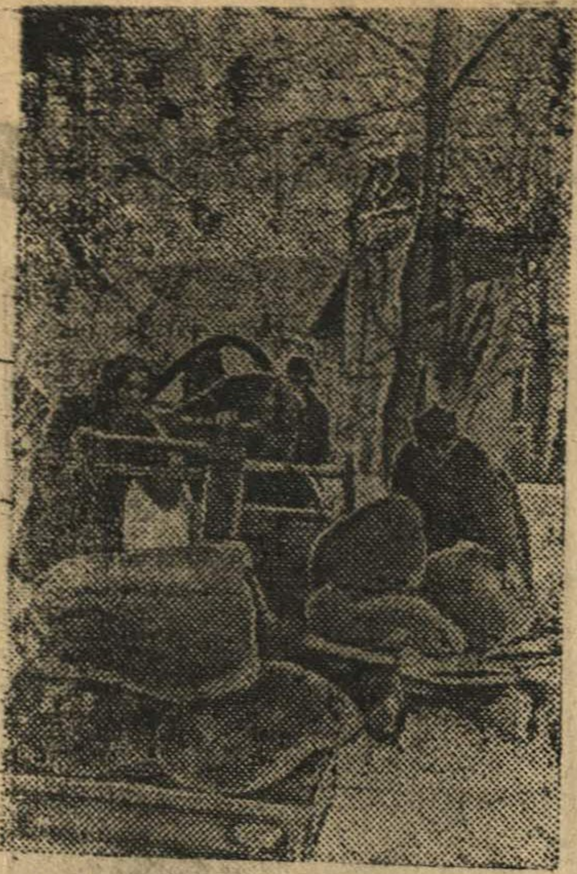
Ивановские колхозники выделали 65 тысяч пудов семян и 1500 голов скота для восстановления колхозного хозяйства Сталинградской области.

На снимке: в колхозе имени 1-го съезда колхозников-ударников (Ивановский район) взвешивают семенную рожь перед отправкой в районы Сталинградской области.