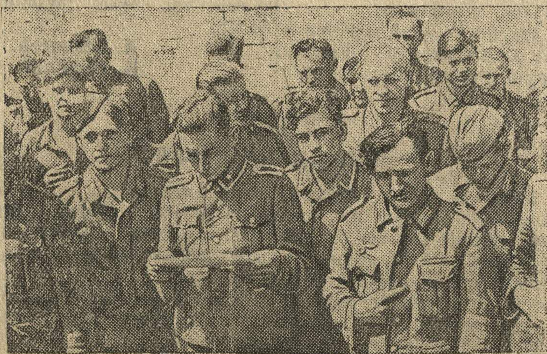
Группа пленных (немцев).