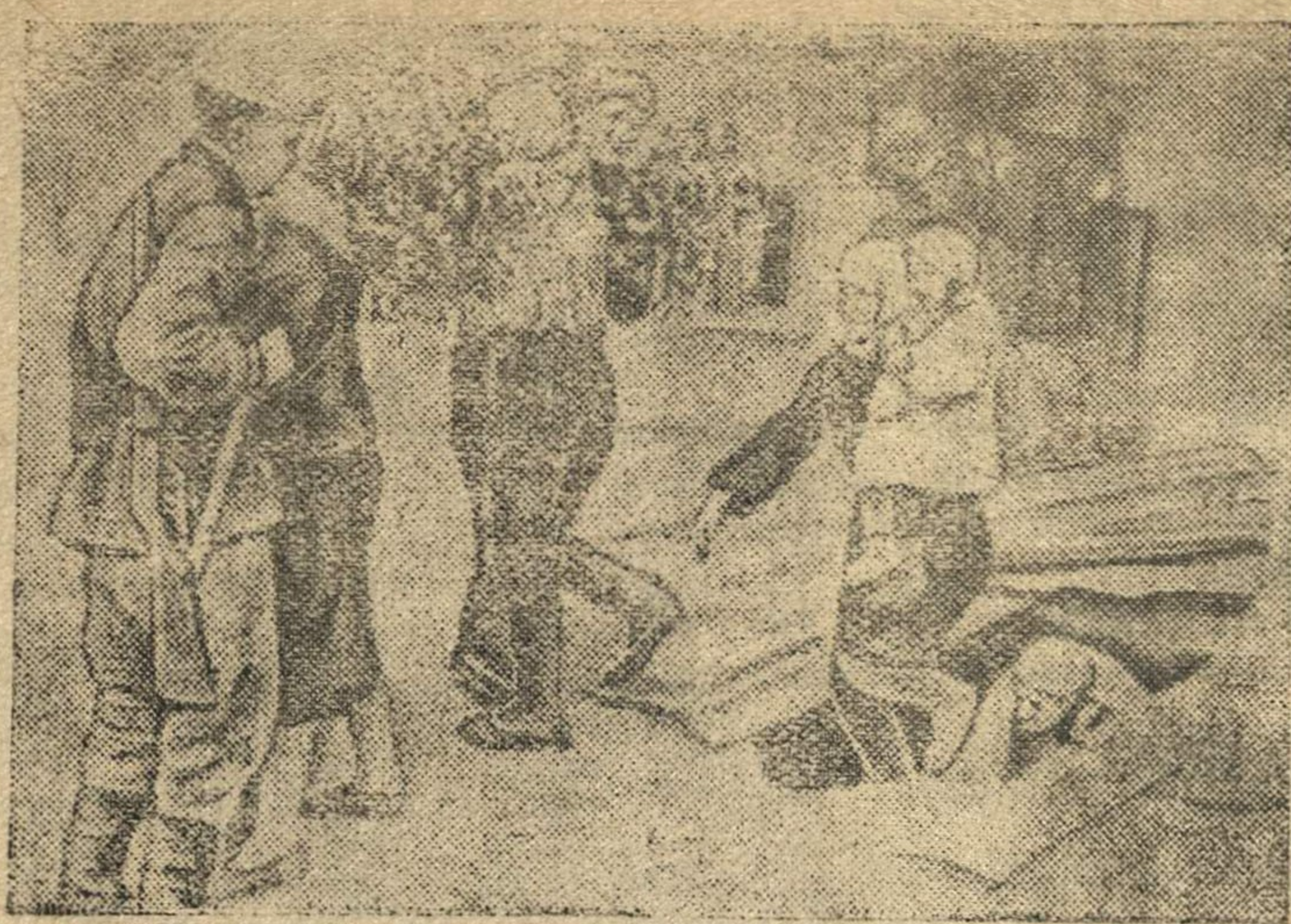
В освобожденной от немецких захватчиков станции Крымской на Кубани.

Двойку паров закончить в северных районах не позднее 25 июля, а в южных и пригородных — не позднее 1 августа.