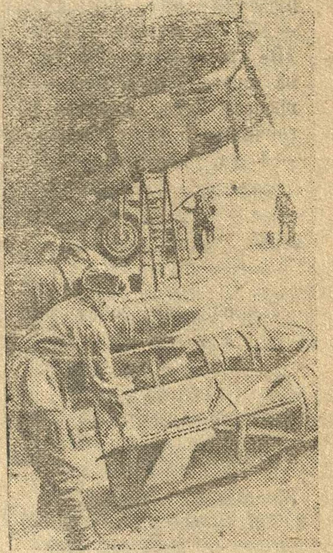
На снимке: На аэродроме Н-ской части.