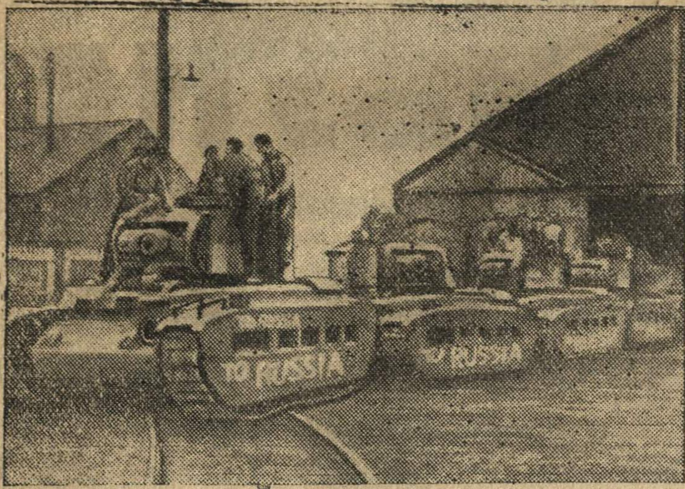
Неделя «Танки для СССР» в Англии.

Танки, выпущенные одним из английских заводов. Рабочие завода написали на каждом танке: «В Россию». (Передано по бильду из Лондона).