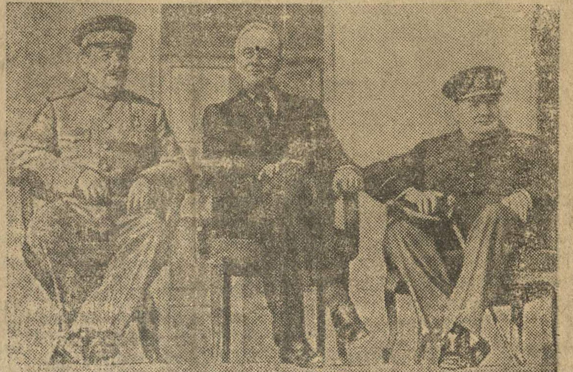
На снимке: Председатель Совета Народных Комиссаров Союза ССР тов. И. В. Сталин, Президент Соединенных Штатов Америки г-н Ф. Д. Рузвельт, Премьер Министр Великобритании г-н У. Черчилль. (Снято в Тегеране во время Конференции руководителей трех союзных Держав).

6. Обучать в зимних условиях для полевых и транспортных работ дополнительно 750 голов крупного рогатого скота с тем, чтобы в 1944 году работало не менее 1000 голов.