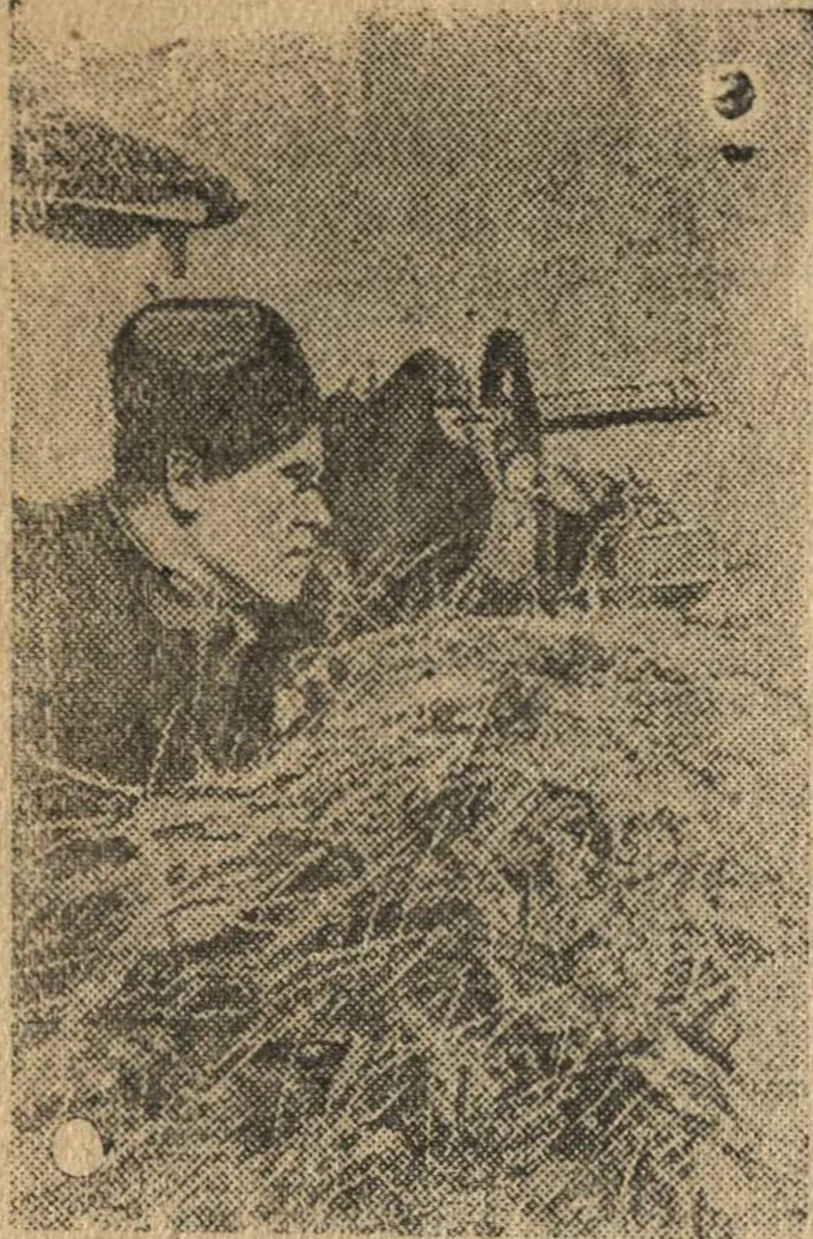
На снимке: Старший лейтенант Г. К. Наметченко — командир пулеметного эскадрона. Ворвавшись в населенный пункт, он лично убил 13 фашистов. Отважный кавалерист награжден орденом Красной Звезды.