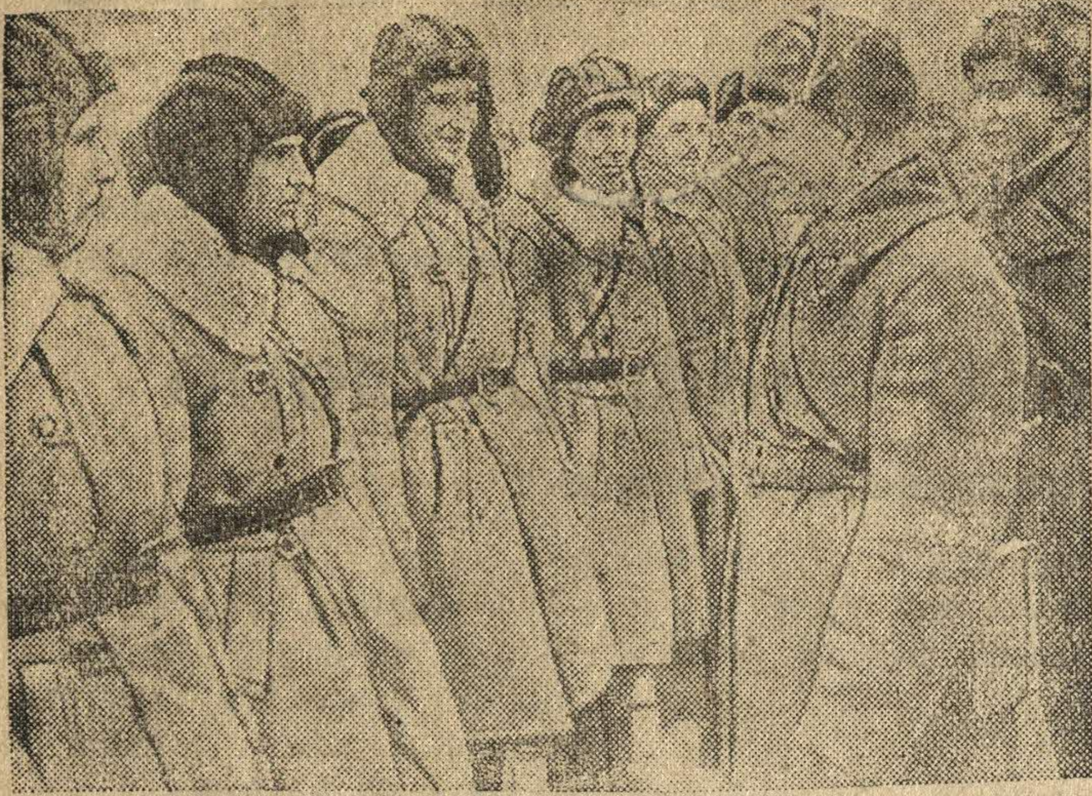
Командир гвардейской дивизии Герой Советского Союза полковник тов. Лизюков беседует с гвардейцами-таявистами.

Героически сражаются с фашистскими бандитами таявисты 1 Гвардейской мотострелковой Московской дивизии.