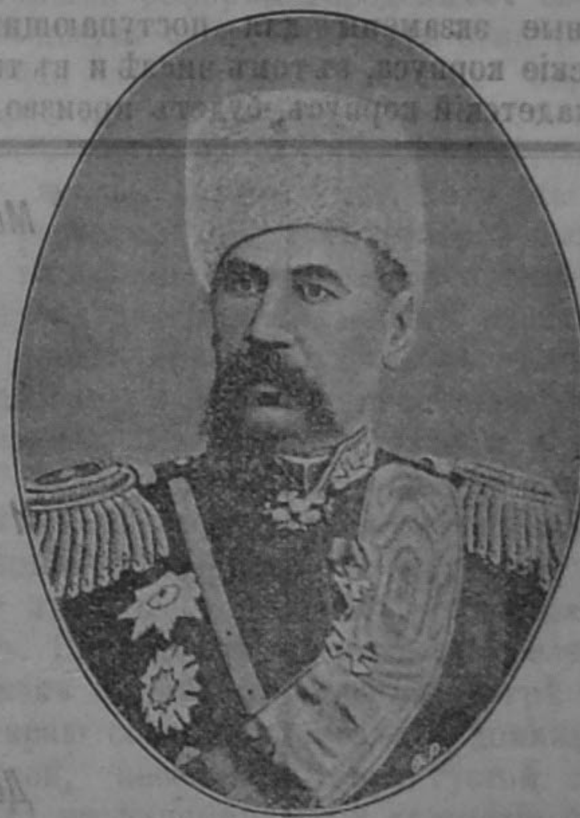
Начальникъ нижегород. губ. генераль-лейтенантъ П. Ф. Унтербергеръ.

Отвѣчая на рѣчь городского головы, его превосходительство выразилъ, что онъ всегда