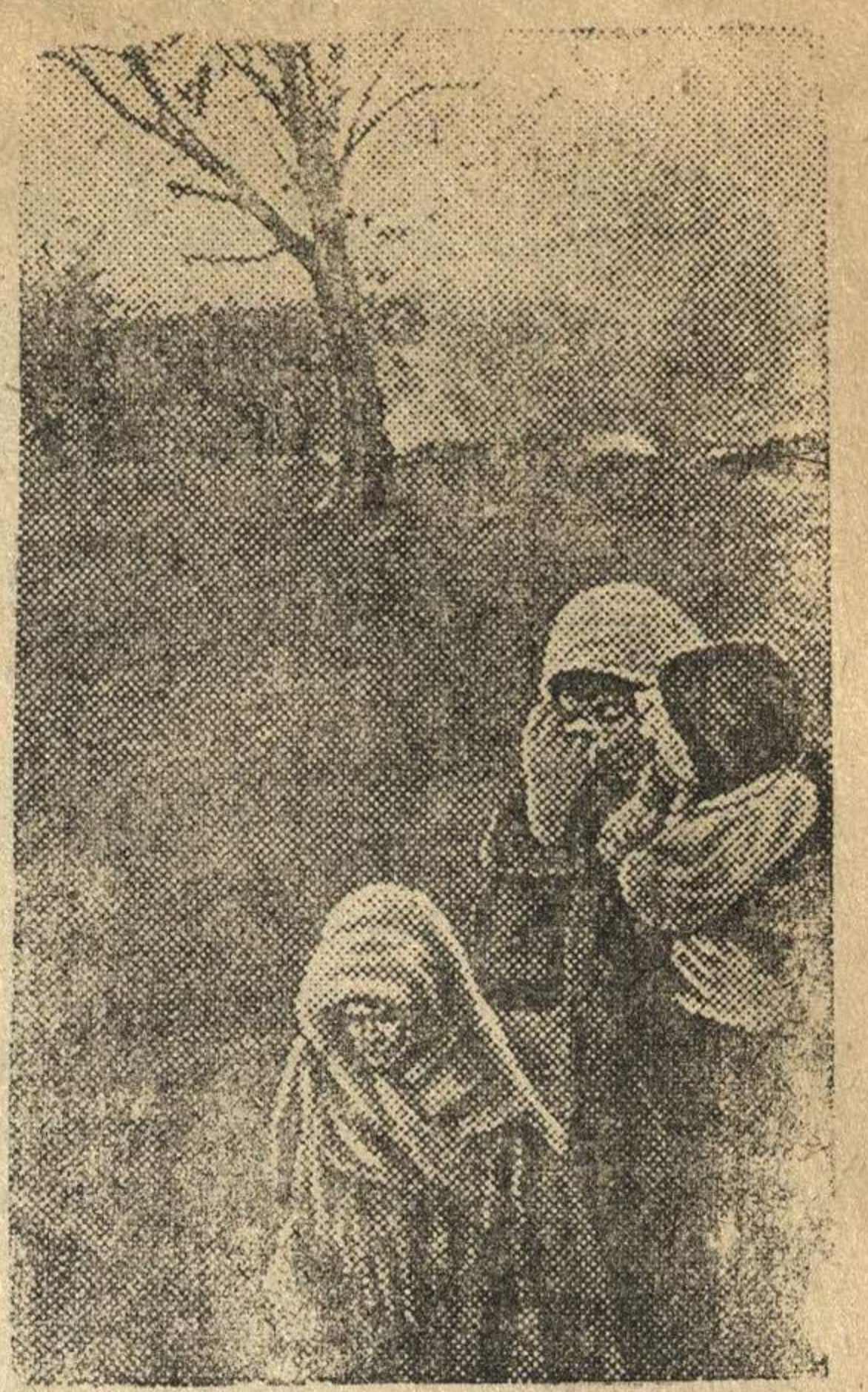
В селе Серболово, Ленинградской области, сожженным гитлеровскими захватчиками.