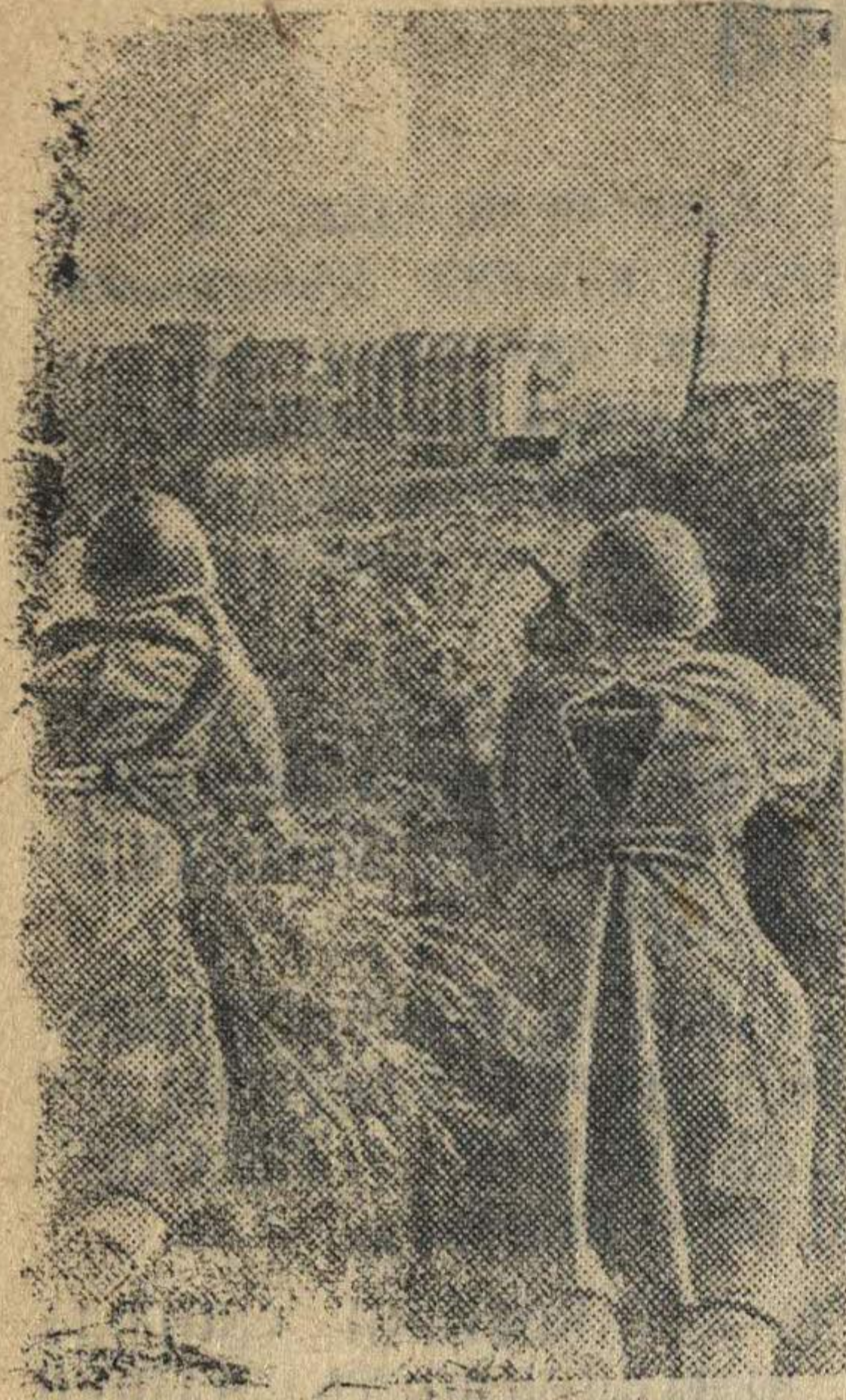
На снимке: Автоматчики обстреливают засевших в соседних кварталах немцев.