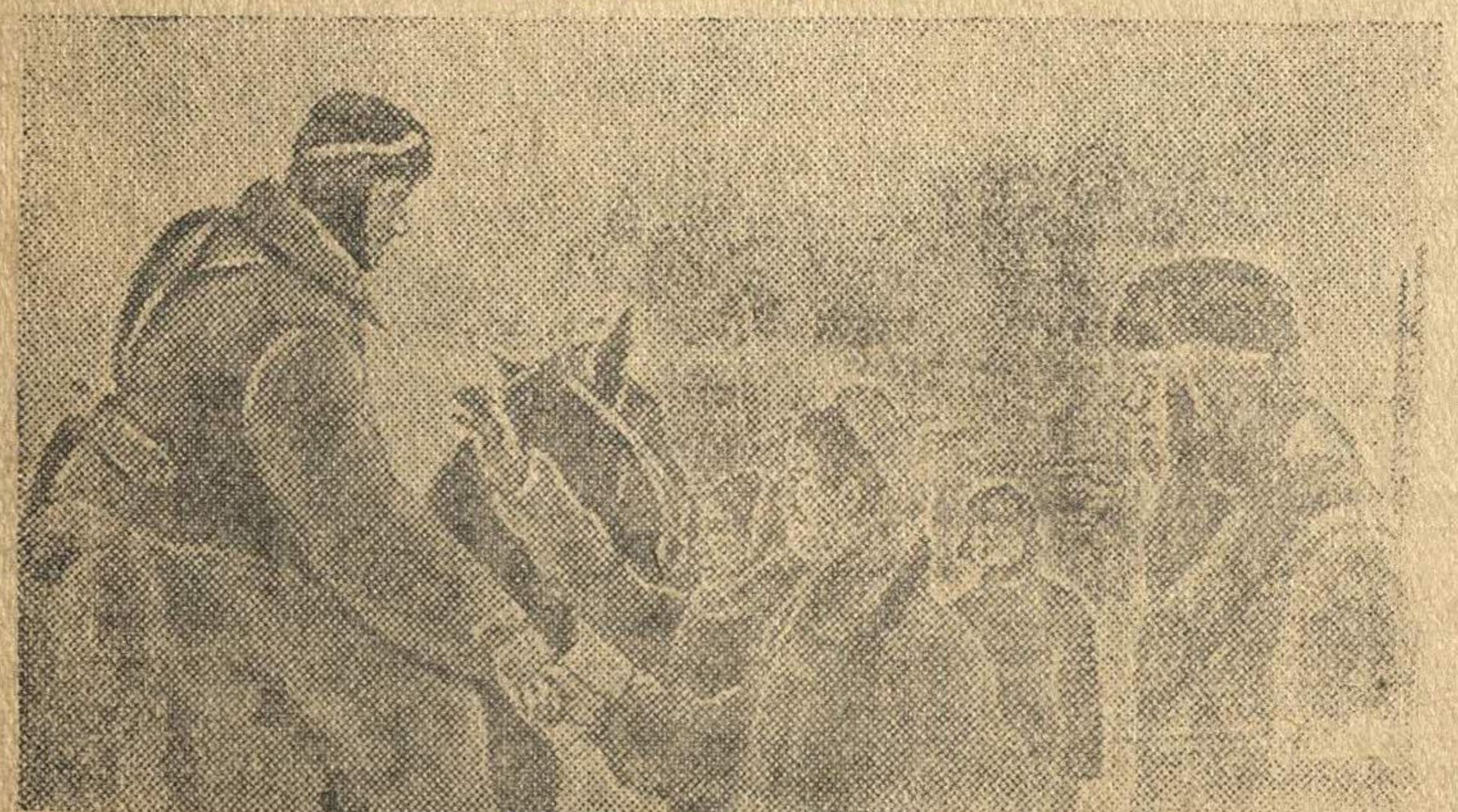
На снимке: Жители города радостно встречают своих освободителей — воинов Красной Армии.