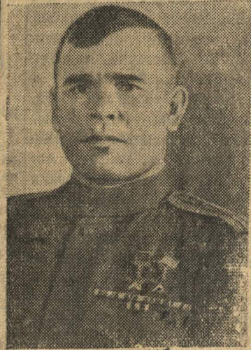
Летчик-истребитель майор Арсентий Васильевич Ворожейкин лично сбил 46 немецких самолетов. Отважному сталинскому соколу вторично присвоено звание Героя Советского Союза.

обучению крупного рогатого скота были, безусловно, выполнены. Героическое продвижение Красной Армии на запад обязывает нас вести большую подготовительную работу в подготовке к весеннему севу, дабы образцово подготовившись, провести весенний сев качественно и в сжатые сроки. От того, как мы проведем весенний сев будет зависеть получение высокого урожая, а борьба за высокий урожай — наш священный долг перед родиной и Красной Армией, наша главная обязанность в деле окончательного разгрома врага.