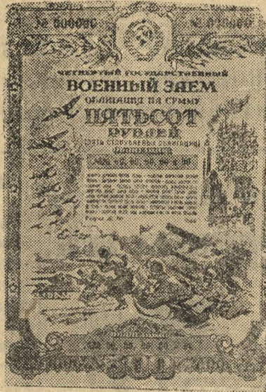
Образец облигации достоинством в пятьсот рублей.