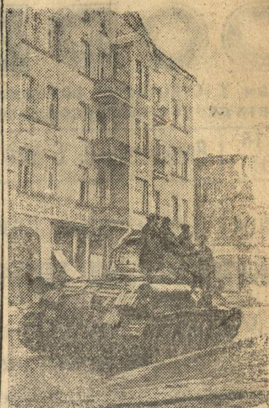
На улицах немецкого гетто Штольи, занятого нашими войсками.