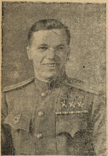
Трижды Герой Советского Союза гвардии майор Иван Никитович Кожедуб.