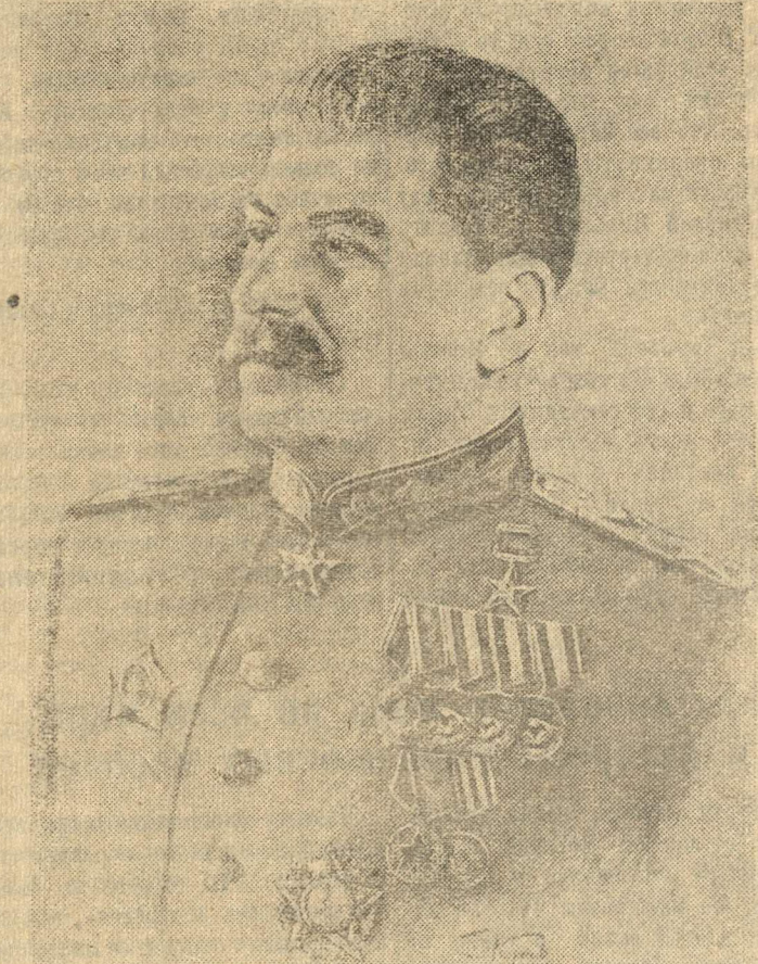
Председатель Совета Народных Комиссаров Союза ССР Генералиссимус Советского Союза И. В. СТАЛИН.

В тех странах, в которые вторглись гитлеровские банды, народ оказался плохо подготовленным для отпора фашистским захватчикам. Лишь постепенно, благодаря усилиям лучших патриотов-демократов, стали складываться и расти демократические силы сопротивления захватчикам. Но даже в тех странах, как в Югославии, где весь народ оказал поддержку восстанию против захватчиков, не хватало сил, чтобы сломить военную мощь гитлеризма. Только тогда, когда наша армия перешла в наступление и начала громить германские войска, сорвав с них ореол непобедимости, открылись широкие возможности для освобождения народов, поработенных германским империализмом. Двигаясь на запад, Красная Армия принесла освобождение соседним странам и другим народам Европы.