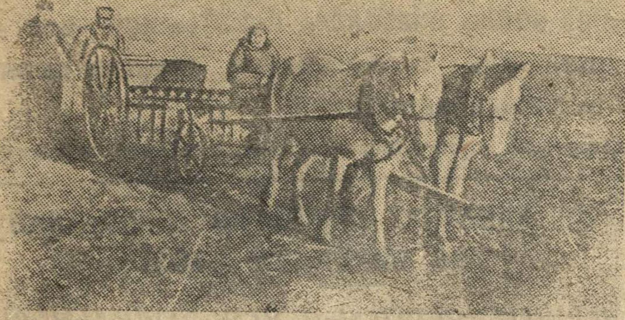
На снимке: Сев пшеницы в колхозе «Красная Заря» (Целинский район, Ростовская область).